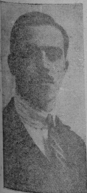
El príncipe Luis de Borbón-Parma, prometido de la princesa Maria de Savoia, hija menor del Rey de Italia.

He aquí el problema que agita a las cancillerías europeas, con motivo de la petición por parte de Alemania, de sus antiguas colonias. De ello van a tratar en las conferencias de hoy en París Chamberlain, Halifax, Daladier y Bonnet