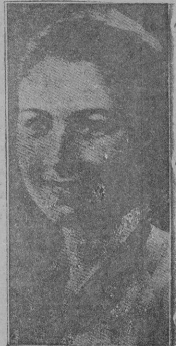
La reina Farida, de Egipto, que acaba de dar al trono una princesa

—Algo terrible — me responde — Dos otras horas después yo bajé del árbol en cuya copa frondosa me había escondido. Entonces tuve que experimentar el dolor de ver que los canallas, para vengarse, se habían llevado a mi mujer. Desesperado, acudí a ver al Gobernador, pues éste, por temor a la Aviación Nacional, pasaba las noches en el pueblecito donde residíamos. El que hacía de Goberna