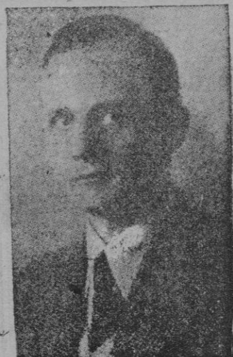
El secretario de la Embajada alemana en París, Von Rath, asesinado por un judío

Francamente, yo no entiendo las razones de Negrin, y hasta, a veces, voy creyendo si hay en su testa serrin, y todo aquél que no es ciego o de bermeja mollera ha de ver como navego