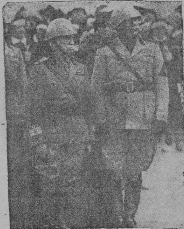
El Rey de Italia con Mussolini, en uno de los desfiles recientemente celebrado en Roma