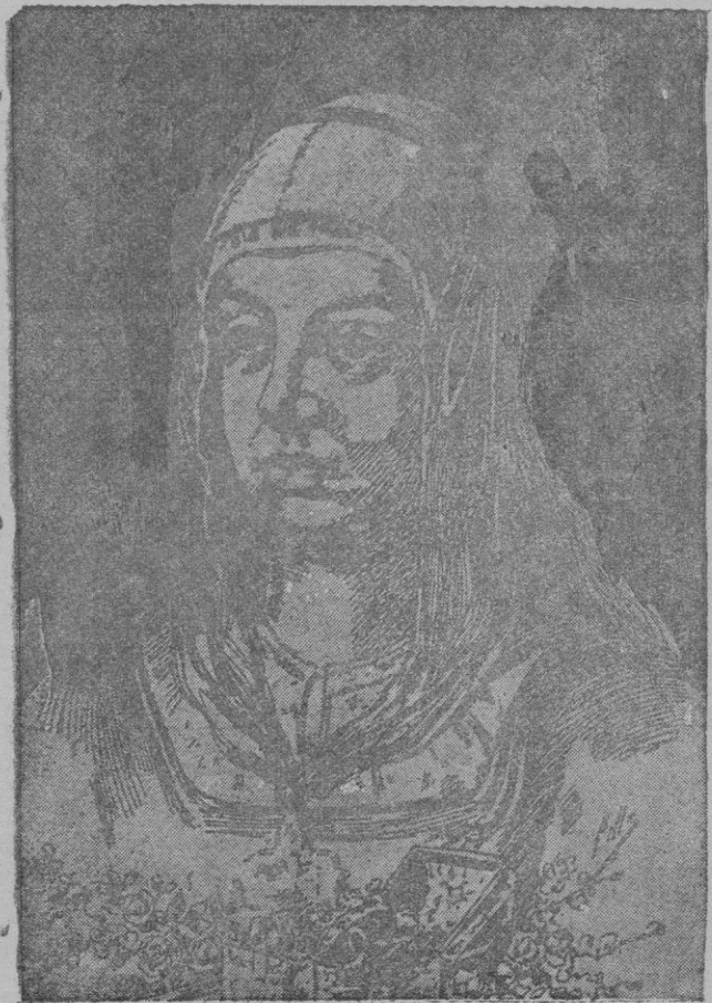
Isabel la Católica