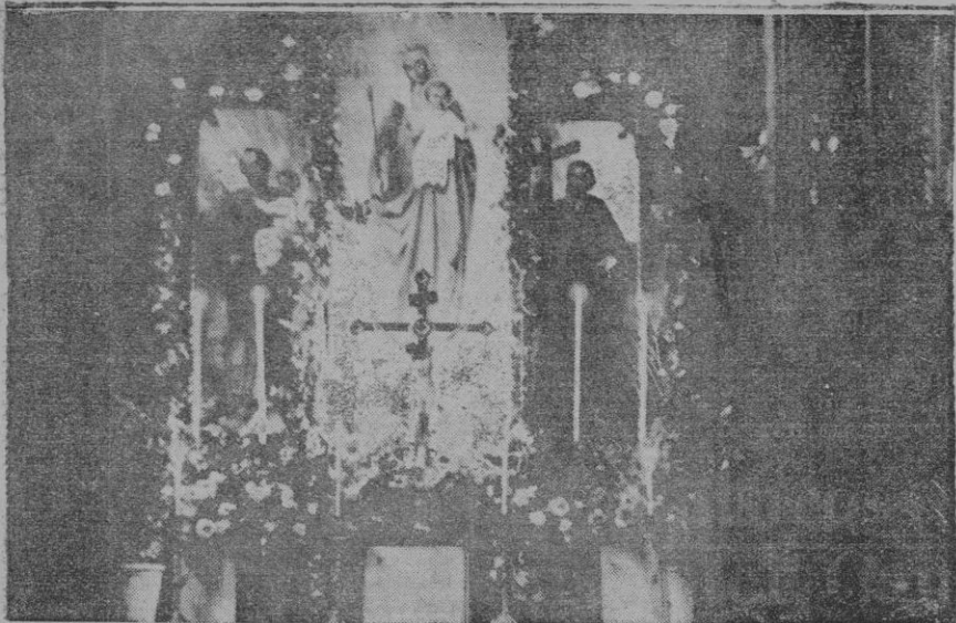
Aspecto que ofrecía el altar de la capilla de la Prisión Provincial, durante la fiesta allí dedicada a María Auxiliadora