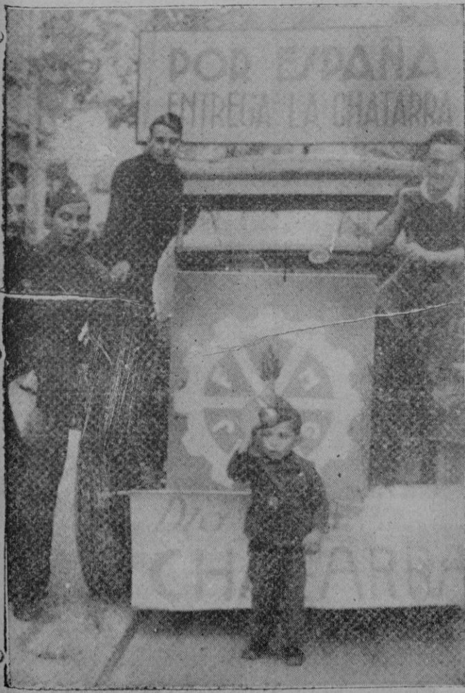
Uno de los camiones dedicados a la recogida de chatarra que ayer circularon por Palma

Hierro viejo, chatarra... Materia enmohecida en informe montón... Y