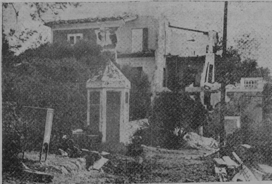
Estado en que quedó "Ca'n Servera", nido turístico en Porto-Cristo, después de ser profanado por los rojos

El paisaje que se extiende entre la veta costera y los alcores que limitaban el palenque desde Son Servera a San Miguel, no lo es de exuberancias ni de ingentes alturas, pero tiene el suave aspecto de una caricia femenina con turgencias de senos, regazos en deliciosas playas y bocas en ensenada que sonrían al ánimo y mordisquean de amor, empapados los labios ambaginos de espuma marina. El día siguiente al de la Conmemoración, recorrí de nuevo en devoto