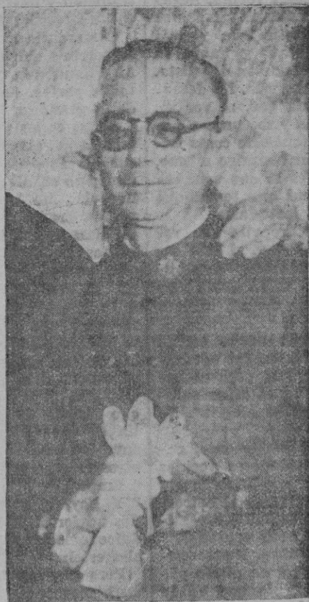
El Excmo. Alcalde de Palma, D. Mateo Zaforteza