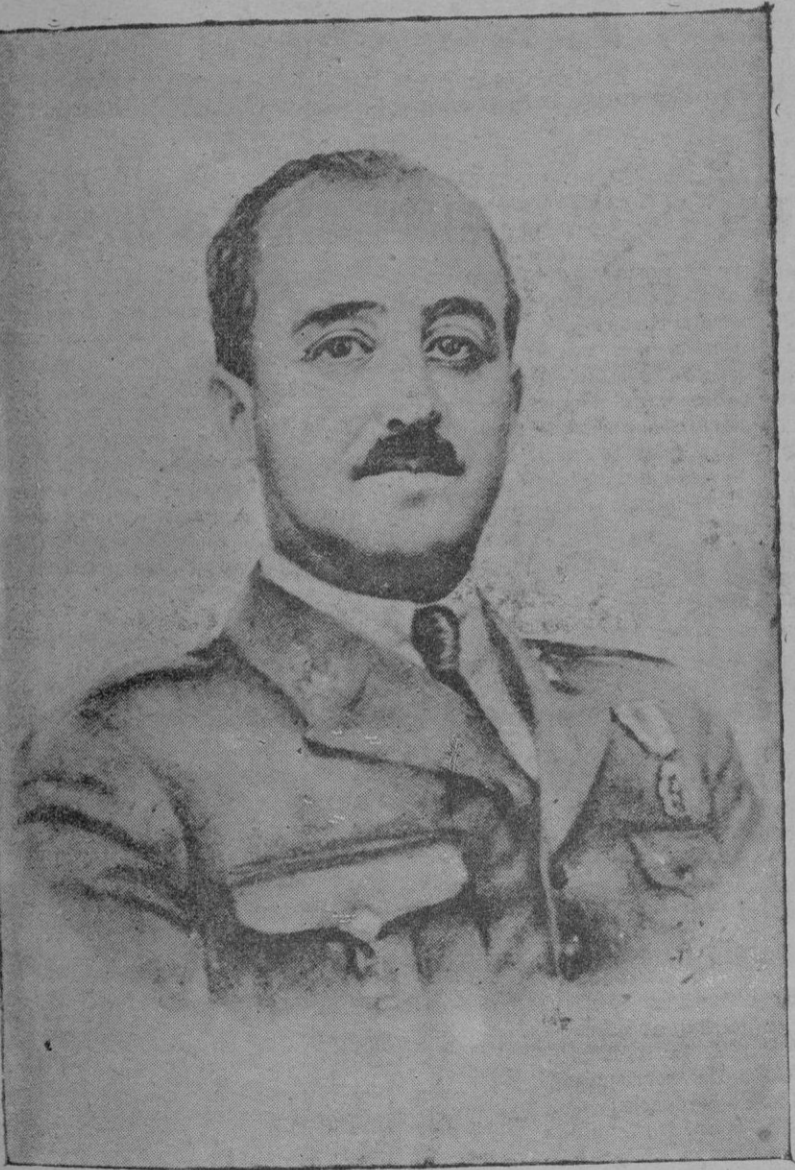
mo. Sr. D. Francisco Franco Bahamonde, Generalísimo y Jefe del Estado Español