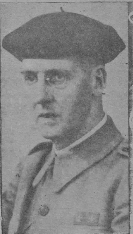
Sr. Conde de Torresaura, Secretario provincial de F. E. T. y de las J.O.N.S.

raza Hispana, y fueron levantadas las banderas, echadas al vuelo las campanas de la propaganda, y espar- ciéronse por toda la España aque- llos haces de muchachos indómitos que llevaban como enseña de su cau- sa una bandera roja y negra y unas flechas imperiales aunadas por un yugo.