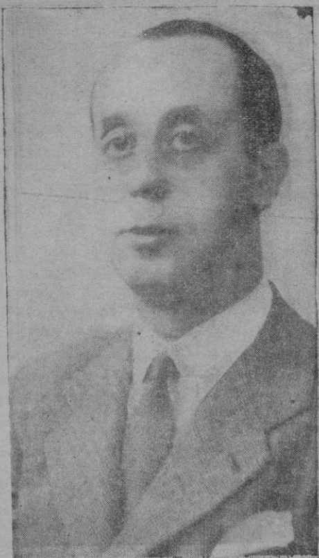
El Excmo. Gobernador Civil D. José Quint Zaforteza