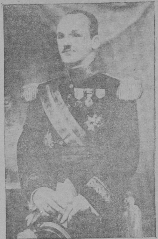
El General Exmo. Sr. D. Manuel Goded, que salvó a Mallorca de los rojos

Por la noche, camino de mis que- haceres periodísticos, varios amigos