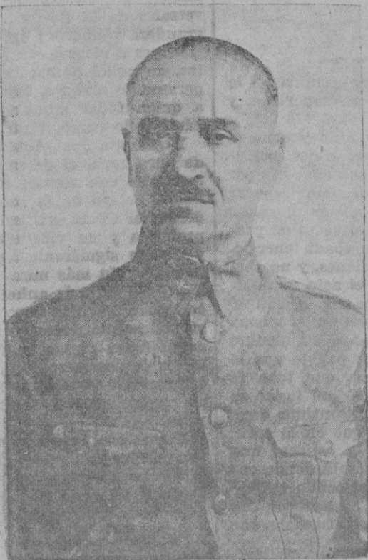
El Exmo. General D. Gonzalo Queipo de Llano