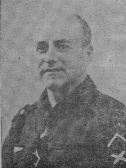
Sr. Marqués de Zayas, Jefe provincial de F.E.T. y de las J.O.N.S.

Y entonces el niño dió miedo, y em- pezó la persecución, y fué la cárcel su destino, y fué su sombra la ven- ganza, y fueron jueces y magistrados los que vieron salpicadas sus caras por el líquido contenido de un tinte- ro febrilmente lanzado por aquel mu- chacho que creía y tenía fé en la jus- ticia y que vivió con asco que estaba al servicio inicio de una política ras- trera y caciquil. Y fué su protesta lan- zada por todos los ámbitos de Espa- ña, y aquella protesta como aquellos gritos estentóreos contra el Parla- mento y la farsa política fueron re- cogidos por una masa juvenil de la