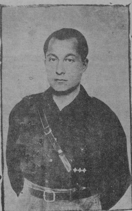
D. José Antonio Primo de Rivera