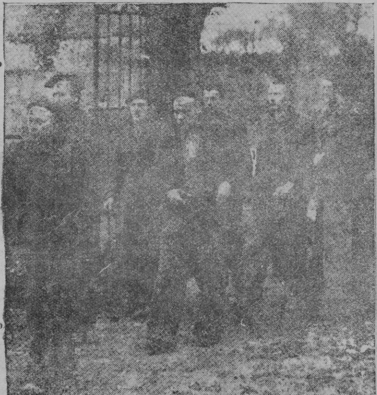
Prisioneros hechos en el frente de Madrid a la Brigada Internacional, al llegar a Talavera de la Reina