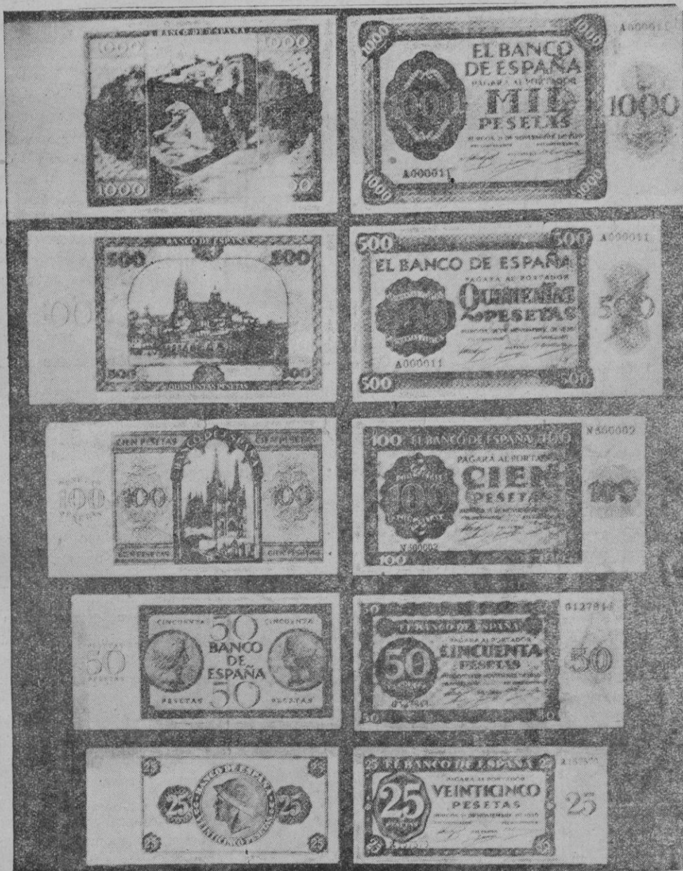
Los nuevos billetes del Banco de España, cuyo cange empieza hoy en Palma

Erase una vez un hombre que se empeñó en ser feliz. Caviló y volvió a cavilar. Meditó largamente; pero cuanto