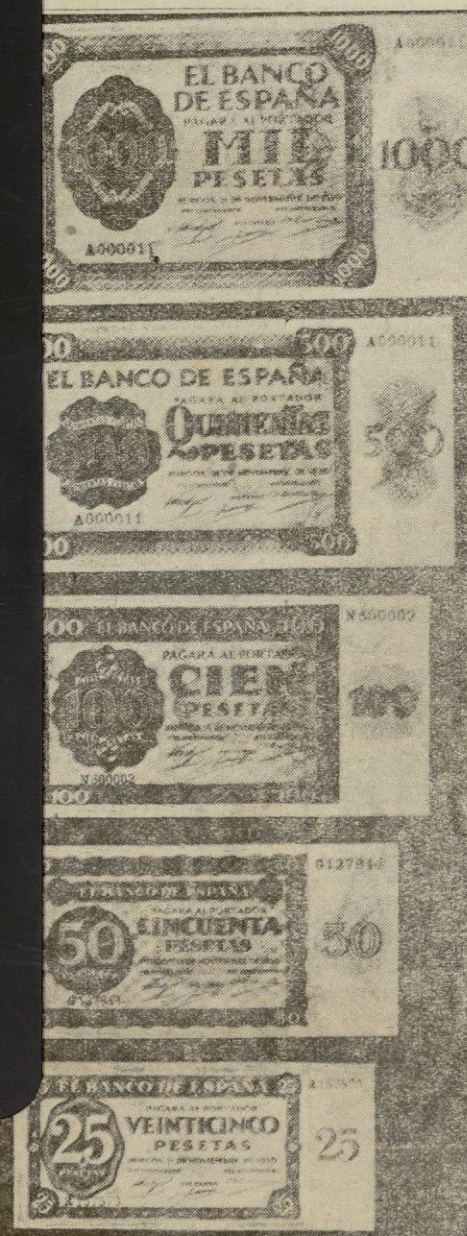
Los nuevos billetes del Banco de España, cuyo cange empieza hoy en Palma

Erase una vez un hombre que se em- peñó en ser feliz. Caviló y volvió a ca- vilar. Meditó largamente; pero cuanto