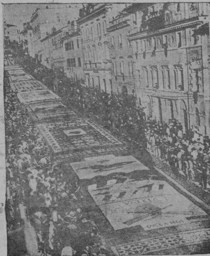
El Corpus en Genzano, en las cercanías de Roma. Las calles de la población estaban cubiertas por verdaderos mosaicos de pétalos de flores, que dibujaban vistosos adornos e inscripciones

Mañana Sábado Tarde y Novhe, grandes partidos y quinielas.