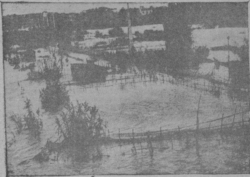
En Valencia, a consecuencia de los temporales de agua iniciados el sábado, se produjo el desbordamiento del río Turia, que inundó la parte baja de la ciudad