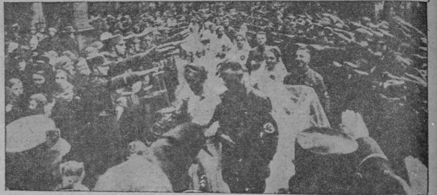
He aquí doce antiguos militantes del nacionalsocialismo alemán que se han casado al mismo tiempo en Chemnitz