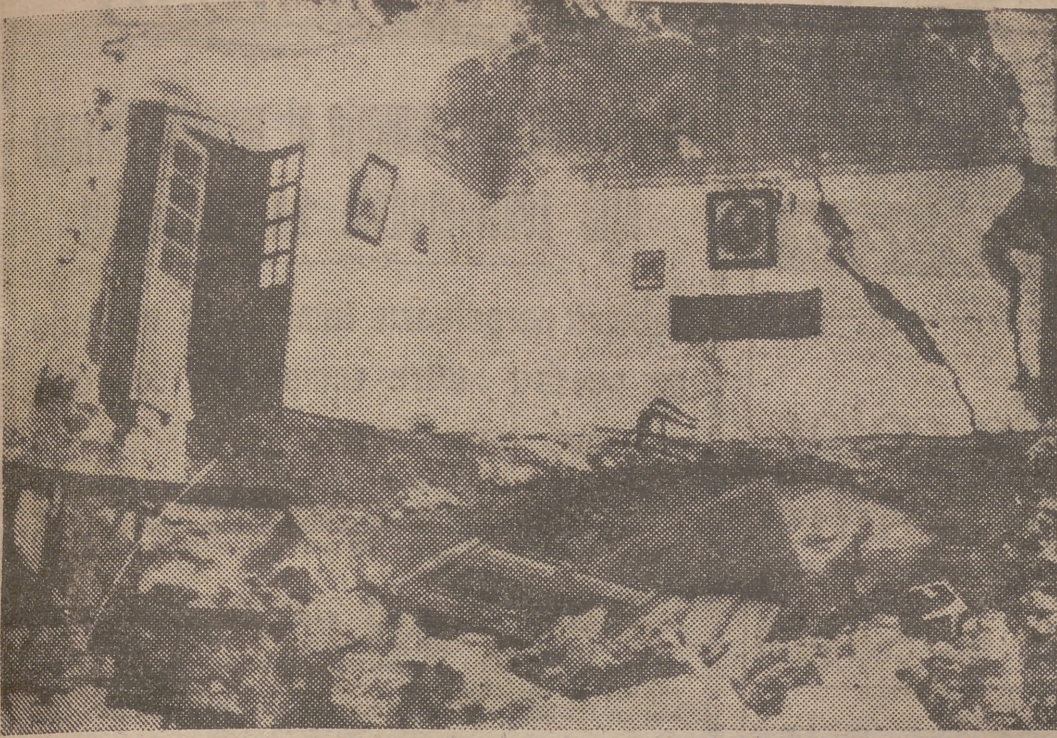
SANTORIM (Mar Egeo).—Estado en que quedó una casa de la isla de Santorim, aldea de Thira, a consecuencia del terremoto que ocasionó varias docenas de muertos y heridos.