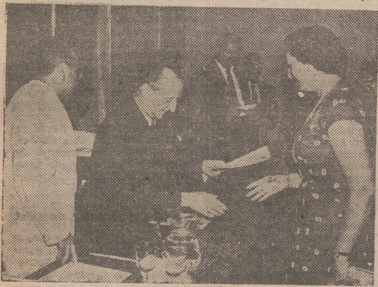
El delegado de Trabajo entrega uno de los nombramientos de agente de la propiedad inmobiliaria.

Presidió el delegado de Trabajo, señor Ojea