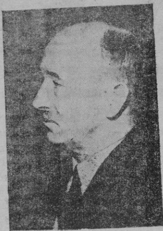
Eduardo Benés, llegado Presidente de Checoslovaquia

Se convoca a los cursillistas aprobados en el tercer ejercicio que, no obtuvieron plaza para, para mañana domingo a las 11 en el "Museo Pedagógico". —La Comisión.