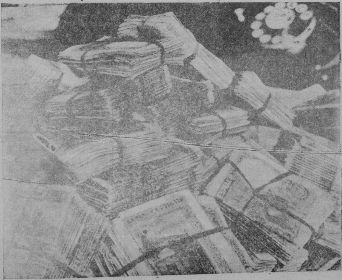
No es un anticipo del "gordo" sino el millón y medio que los atracadores se llevaron de la Casa de la Villa de Madrid y que la policía ha recuperado

He ahí explicada y aun justificada la aparente apostasía de Benito Mussolini. Su sentimiento de justicia no ha variado; lo que ocurre es que se ha desplazado de lo internacional, que era pura quimera a la racional que es una realidad viva. El estadista no se ha pasado con armas y bagages a la burguesía. No es un transfuga, sino un pensador que practica un experimento sirviéndose de las masas y de los grupos, de las ideas y de los