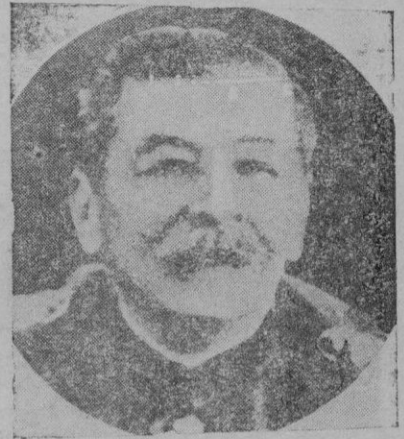
D. Juan Vicente Gómez, Presidente de los Estados Unidos de Venezuela, que ha fallecido

Son dos ideales opuestos predestinados a una permanente rivalidad. Pero ¿no habría modo de refundir los derechos del proletariado con un ideal histórico que respete y venera