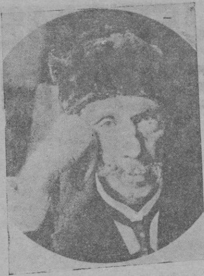
El eminente fisiólogo Charles Richet, que descubrió los fenómenos de la anafilaxia y fundó la ciencia metapsíquica, que ha fallecido en París

Según parece las causas que se supone debieron inducirle a tan extrema resolución, fueron que hace algún tiempo se venía observando que tenía trastornadas las facultades mentales.