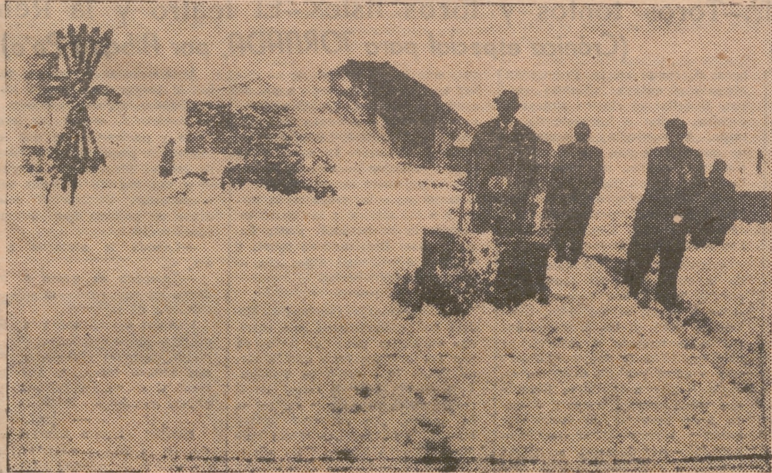
En la Sierra de Guadarrama ha caído la primera gran nevada, cuyo espesor es de cuarenta centímetros. Comienzan los trabajos para limpiar la carretera de la nieve. Este nuevo aparato personal con motor de gasolina, abre el camino en la carretera para el paso de los coches.