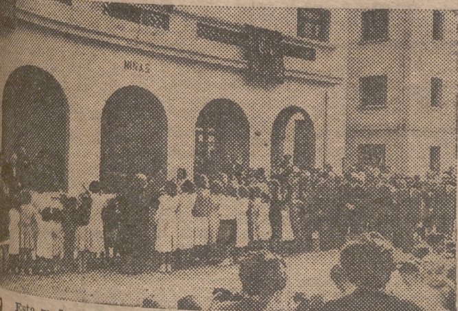
Esta mañana ha sido inaugurado el Grupo Escolar Municipal «Padre Jofre», situado en el bloque de viviendas del Camino de Barcelona, a cuyo acto han asistido el señor Arzobispo, el subje provincial del Movimiento, el alcalde de la ciudad y otras personalidades

(Información en segunda página.)