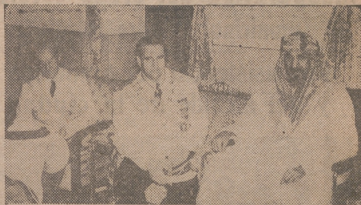
RIAD. — El ministro de Asuntos Exteriores de España, con ocasión de presidir la misión que visitó el Oriente Medio, tuvo ocasión de cumplimentar al viejo "Rey del Desierto", Ibn Saud, que acaba de fallecer. En la fotografía aparecen en el palacio, en compañía del embajador de España, don Domingo de las Bárcenas, habiendo sido permitido obtener esta fotografía por especialísima concesión a la misión española.