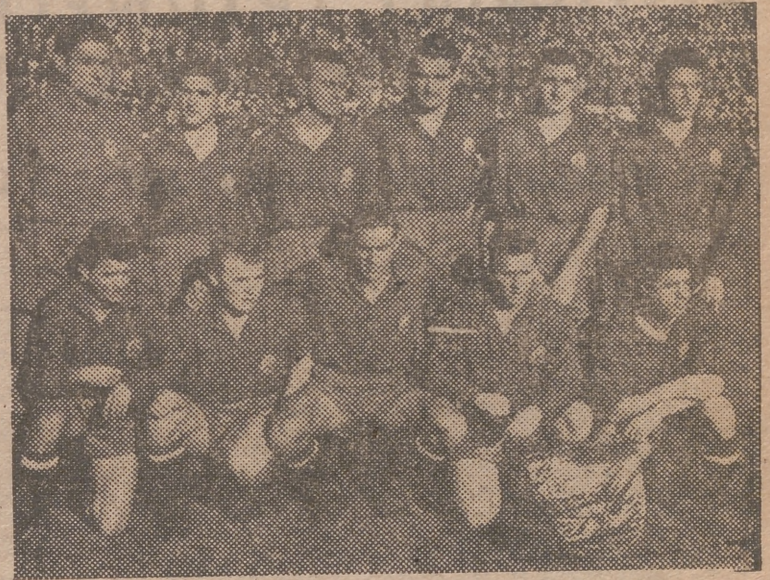
Esta es la selección española que jugó — es un decir — en San Mamés. Una selección que, sin duda, si hay sentido común, no volverá a repetirse. — (Foto Elorza)

El conjunto sueco sigue haciendo un fútbol áspero y profundo, al que colaboran, en la retaguardia, los defensas con lujo de brusquedades, a las que, sin embargo, no se les puede imputar mala intención; y en la delantera, unos hombres duros y rapidí-