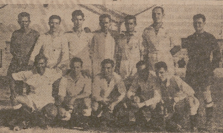
El Sueca consiguió un positivo en el campo del Alacuás. El próximo domingo reciben los suecanos la visita del Burriana, y el choque entre ambos onces puede proporcionar la sorpresa de la jornada.

Del once del Alacuás se debe destacar la actuación de Vila, López, Ortega y Sánchez; del del Sueca, Olivares, Pallás, Navarro y Granell.