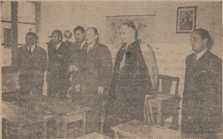
Autoridades y jerarquías visitan las aulas del grupo escolar "Padre Jofré"

Con asistencia del Arzobispo y del alcalde de la ciudad