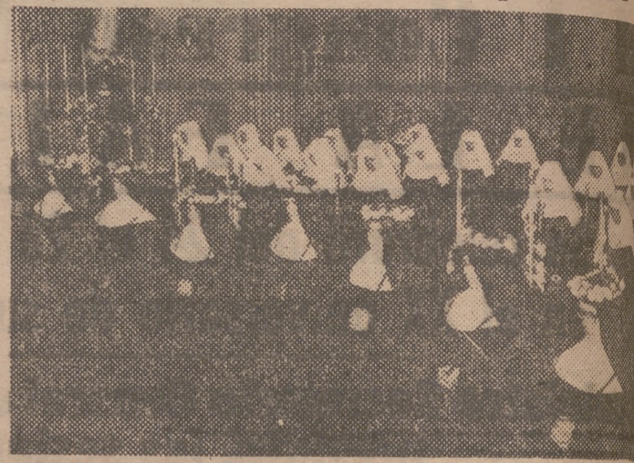
Comunidad de Hermanas, novicias y postulantes de las Hermanitas de Ancianos Desamparados, que ayer asistieron a la vestición de hábitos y profesión religiosa de sus Hermanas de Congregación

La Congregación valenciana de Hermanitas de Ancianos Desamparados, ha recibido la visita de su cardenal protector. Su eminencia el cardenal Cayetano Cicognani se ha dignado también presidir y oficiar