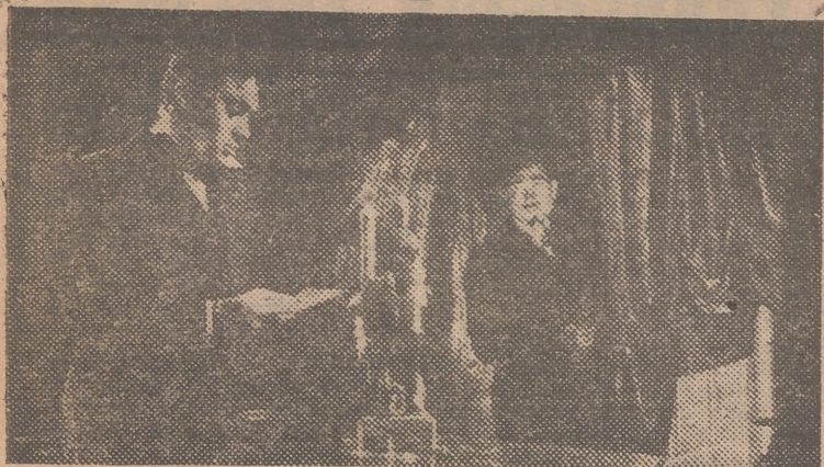
José Luis Ozores y el Gila, el estupendo humorista, son los intérpretes de esta escena de la película "El diablo toca la flauta", que próximamente veremos en nuestras pantallas