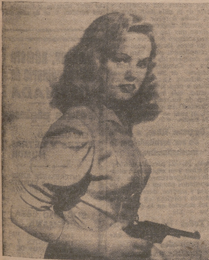
Esta fotografía pertenece a Peggy Cummins, guapa chica, como podrán ver, que desempeña el papel estelar de la película "El demonio de las armas", que se estrenará hoy en el cine Gran Via