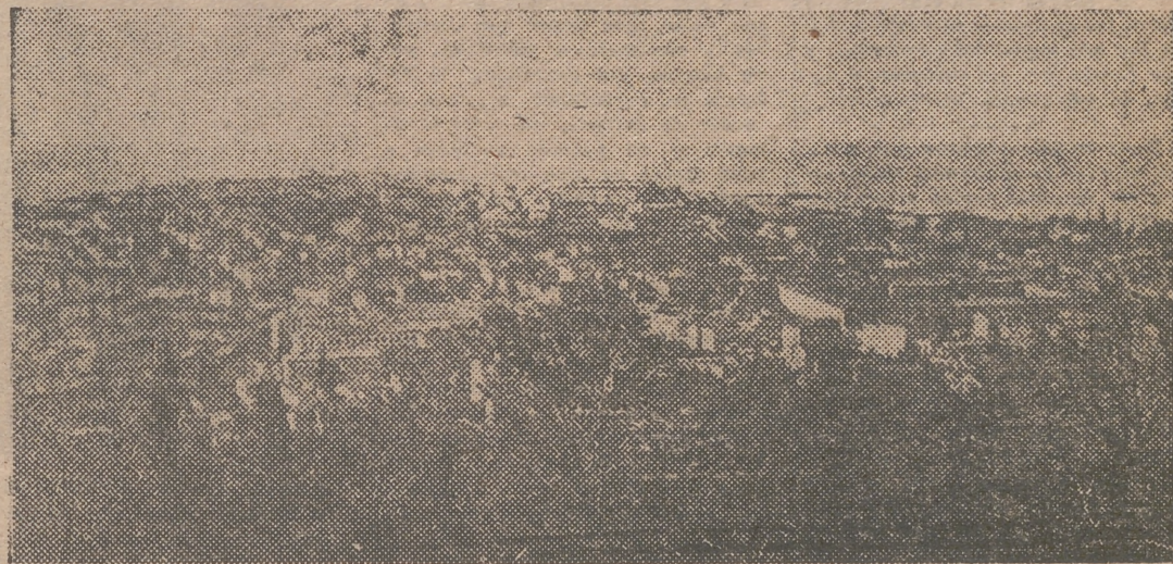
UNA VISTA GENERAL DE TRIESTE

EL «FALSO OBJETIVO» Además, por otra parte, la «Gaceta Oficial» del Gobierno de Tito, del 29 de agosto, hace público que han sido aplicadas en la Zona «B» del Territorio Libre de Trieste otras once disposiciones válidas en