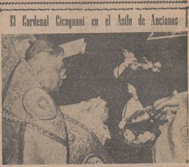
El Cardenal Cicognani en el Asilo de Ancianos. Su eminencia el cardenal Cicognani y pro-nuncio de Su Santidad en España, en el acto religioso celebrado ayer solemnemente en la casa generalicia de las Hermanitas de Ancianos Desamparados, de la que ha sido nombrado por Su Santidad, cardenal protector

La Mesa del Congreso, como ór- (Pasa a la última pág.)