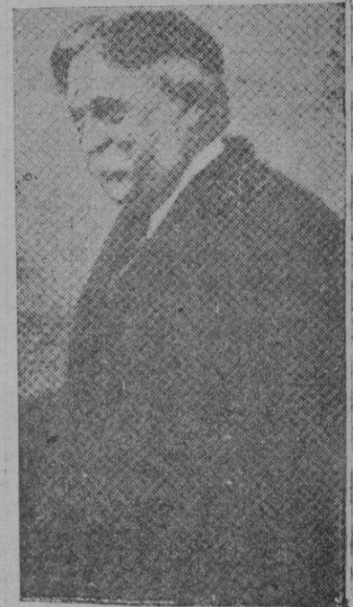
El nuevo Ministro de Agricultura, don Juan de Usabiaga

bles colas que forman a las puertas de las buñoleras, los que van por buñuelos para saborearlos luego en la intimidad del hogar, o en dulce coloquio con "su adorado tormento".