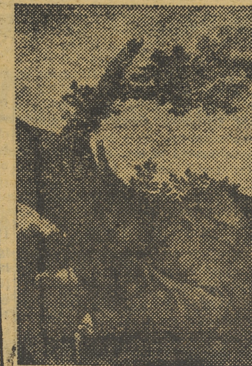
"El sueño de Jacob" (Museo del Prado)

"Su oscura muerte no empañó su gloriosa vida. Sigue siendo el primer pintor español", por lo menos, cronológicamente. Hasta él, la mejor pintura que se hacía en España, era de procedencia o influencia foras-