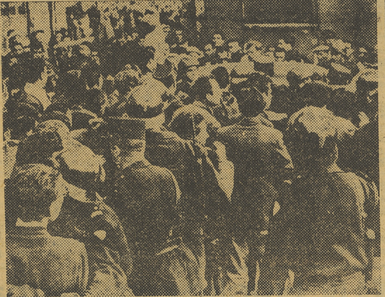
La policía francesa, cargando contra una manifestación de huelguistas comunistas

Conseguirá M. Pinay llevar a buen puerto su ambición patriótica? Ningún observador político na-