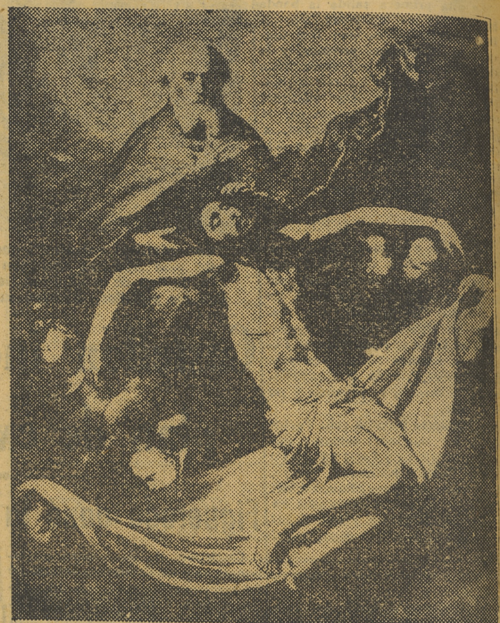
"La Santísima Trinidad" (Museo del Prado)

Ver cómo que el pintor Ribera se formó en el estudio de Francisco Ribalta. Y así como este suceso, y Juan de Juanes