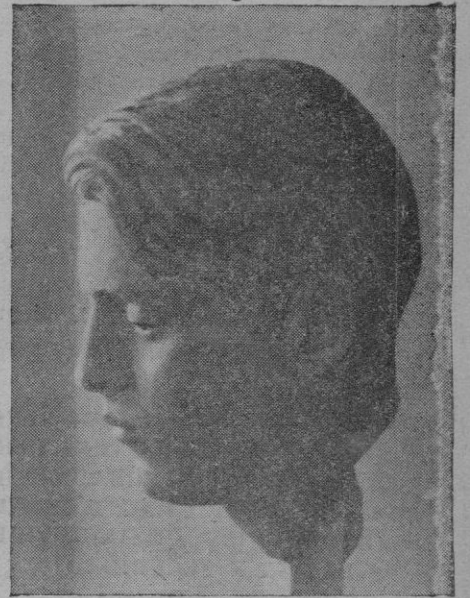
Cabeza de barro moldeada por A. Gittier, del maravilloso pianista que hoy da un concierto en el Palacio de la Almudaina

Las causas que la motivaron, lejos de desaparecer han persistido e incrementado. Con la confianza de que desaparecerían los infrascritos siguieron ostentando las presidencias de comisión y otras delegaciones ya que