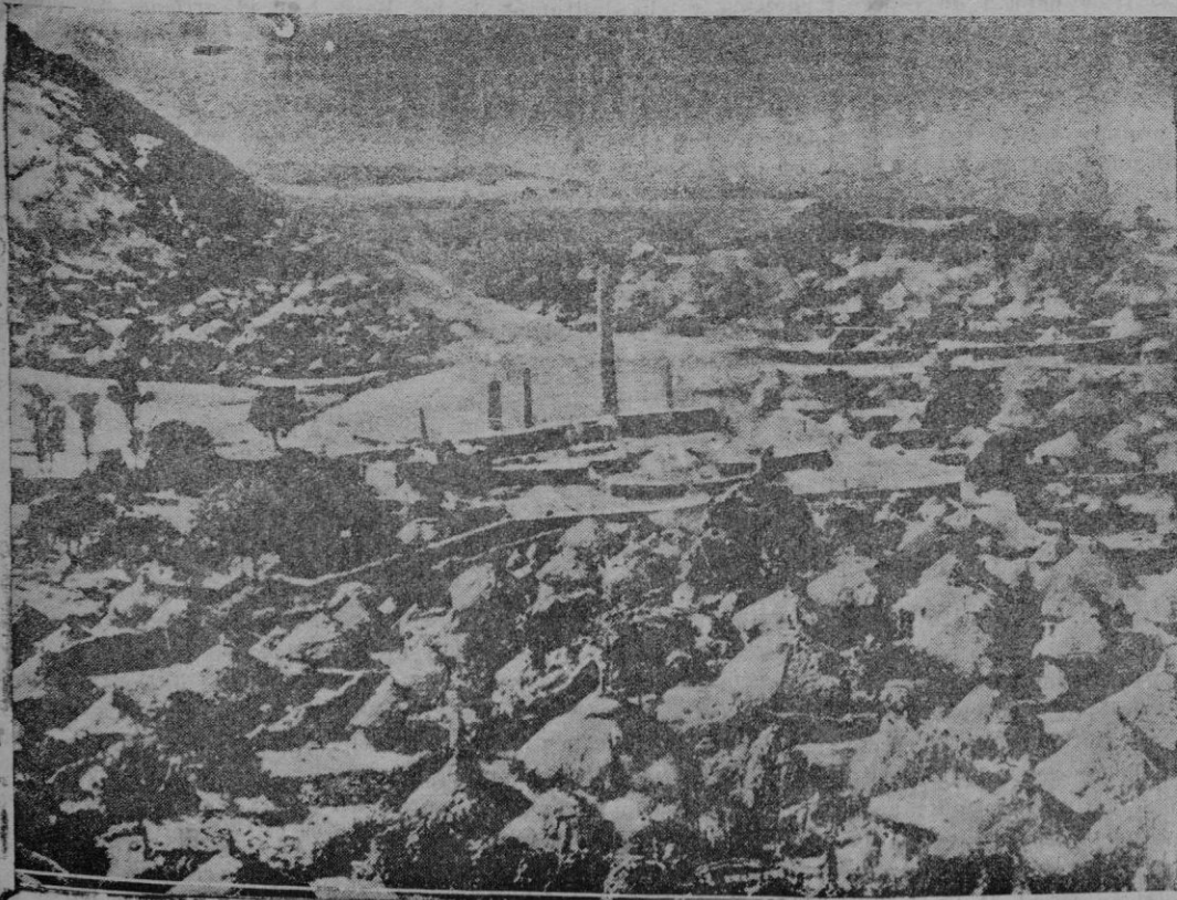
Una vista de Aksoum y sus alrededores cerca de Adua conquistada por los italianos

Tan luego se reciba la comunicación del acuerdo, dictará las disposiciones oportunas para efectuar dicho traslado, procurando llevar a cabo los trabajos en la forma más rápida posible.