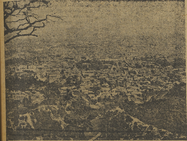
Seul, la capital de Corea del Sur, que ha cambiado varias veces de dueño, en el transcurso de la guerra, y que actualmente se encuentra en poder de los norteamericanos