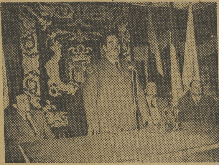
El ministro de Trabajo durante su trascendental discurso a los Montepíos y Mutualidades laborales

Finalizado el acto, el señor ministro se dirigió al aeródromo de Manises, para trasladarse a Madrid por vía aérea. Acudieron, en acto de despedida, el jefe provincial y gobernador civil, y otras autoridades y jerarquías.