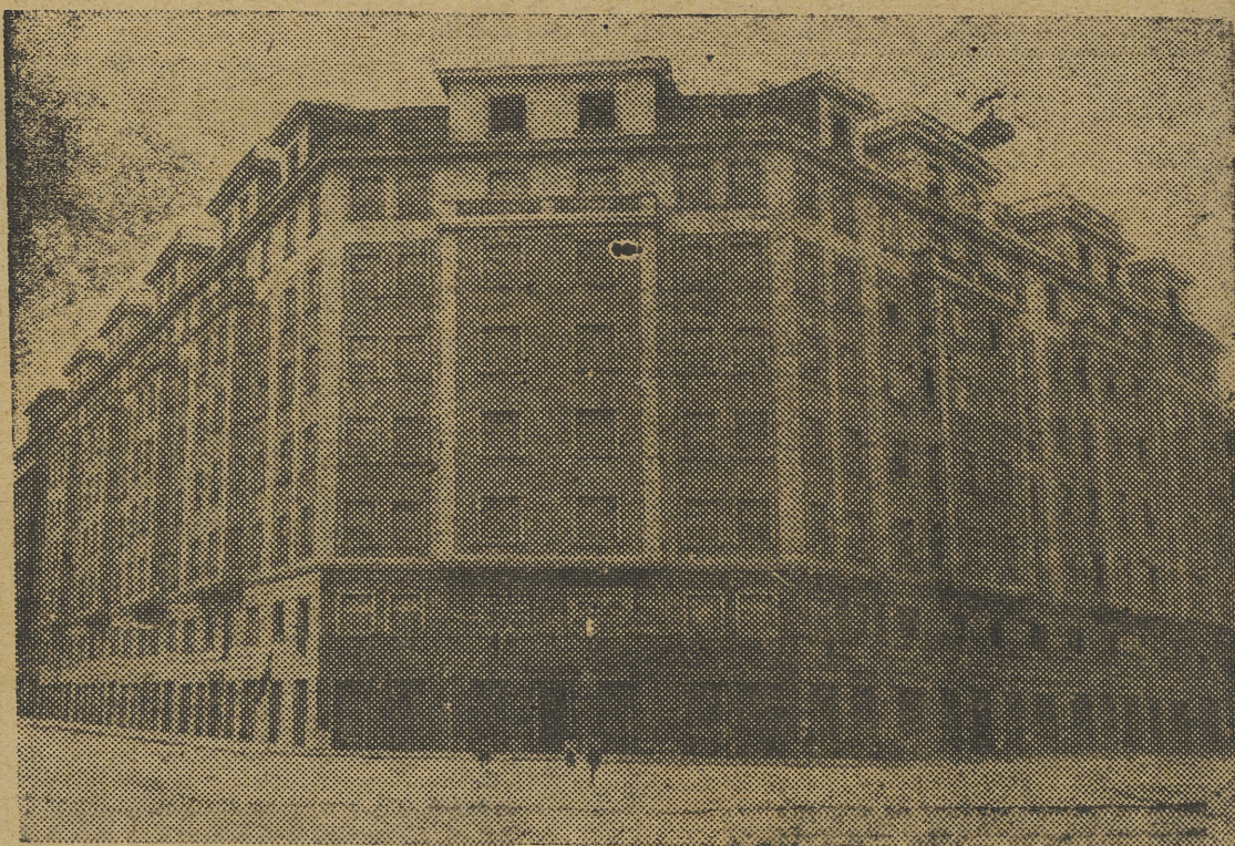
El espléndido bloque de 202 viviendas, de la calle de Angel Guimerá, inaugurado ayer por In-va-le-sa

A continuación hizo uso de la palabra el comisario nacional del Paro, que expresó la gratitud del