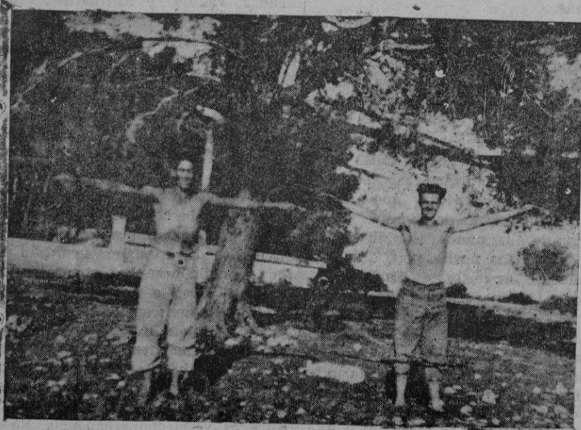
Se someten a un duro entreno de gimnasia y maquina...