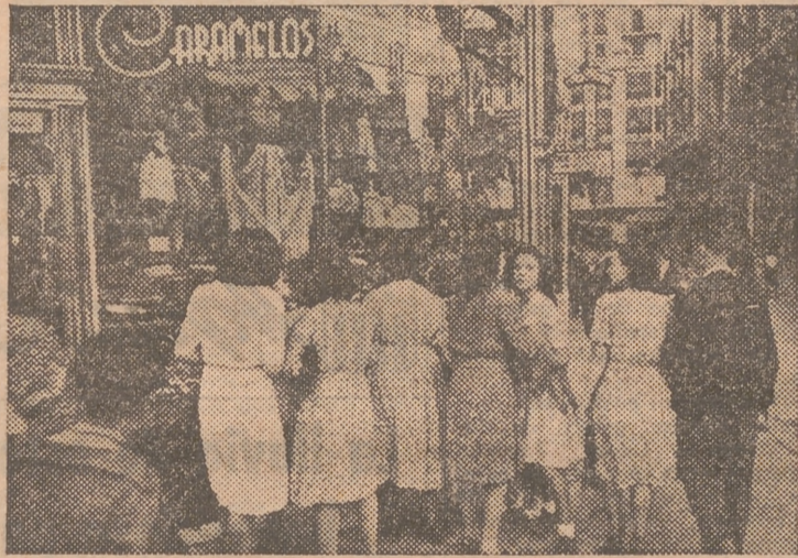
Ellas... evocan la fiesta de "San Dionís" y la costumbre clásica de la "Mocadorá".

Desde hace años se fabrican de pasta de mazapán, conservando la misma figura. Familiares y amigos se obsequiaban mutuamente con estas golosinas el día de San Dionís, dando origen a la "mocadorá", que consistía en un artístico pañuelo de seda, rameado —antano de pita—, en cuya comba se