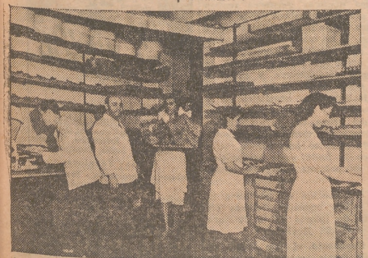
Se trabaja activamente para preparar los dulces y "mocadors" de "San Dionís"

—¿Preocupa la muerte al americano? —El norteamericano quiere ignorar la muerte —lo trágico de la muerte— y la disfraz de vida