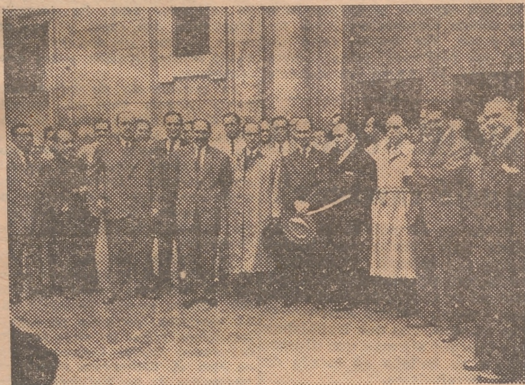
El delegado nacional de Prensa y los periodistas a la salida de la Basílica