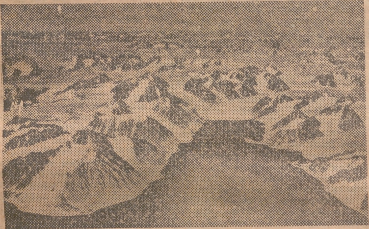
El fiordo Magdalena, punto de partida al Polo Norte de la expedición de Welland y Nordenskjöld. Está situado en la costa oeste y raramente es visitado, siendo sus únicos habitantes dos noruegos que se dedican a la caza de osos, focas y zorros

Los rusos no extraen carbón de sus minas pero abrigan propósitos militares