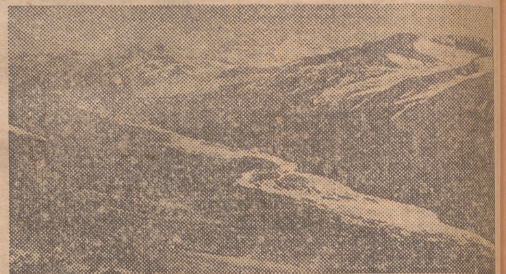
El valle de Longyear, en Spitzberg, en el que está situado el establecimiento minero de Longyear traen carbón de sus concesiones, naciones europeas que vendieron en Spitzberg y es posible que

Balstad dice: "Tenemos todo el alimento que necesitamos. Los cigarrillos van baratos, y