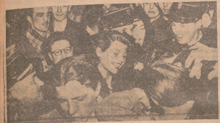
Rita Hayworth, a pesar de haber permanecido tres años ausente de los "plateaux", sigue manteniendo la popularidad de siempre. Véanla, si no, en esta reciente foto, acosada por los buscadores de autógrafos

No encuentran un tema adecuado para su reaparición