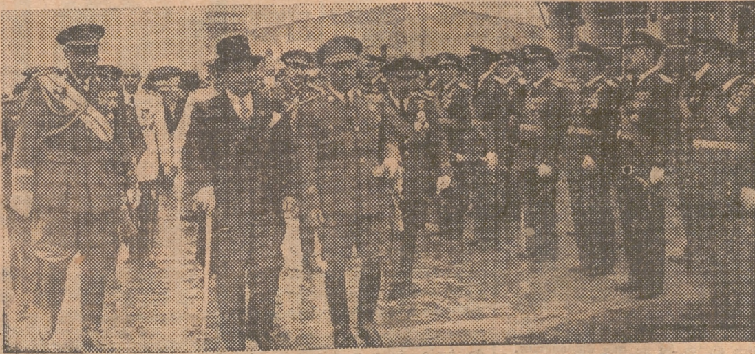
BARAJAS.—El presidente de Filipinas, don Elpidio Quirino, acompañado de S. E. el Jefe del Estado, revista las tropas que le rindieron honores a su llegada a este aeropuerto. Madrid tributó al presidente filipino un entusiasta recibimiento.