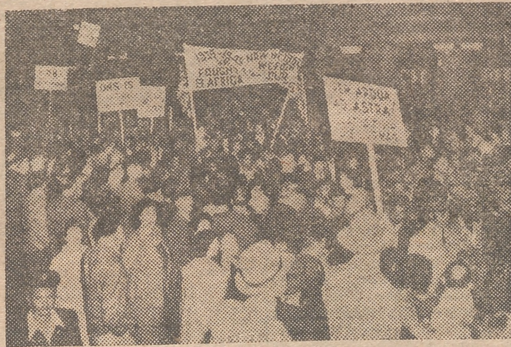
Una manifestación de hombres de color protesta en El Cabo contra las recientes leyes raciales del Gobierno del doctor Malan. El principal organizador de estas protestas ha sido un blanco, el capitán aviador, también de apellido Malan, uno de los ases británicos en la última guerra