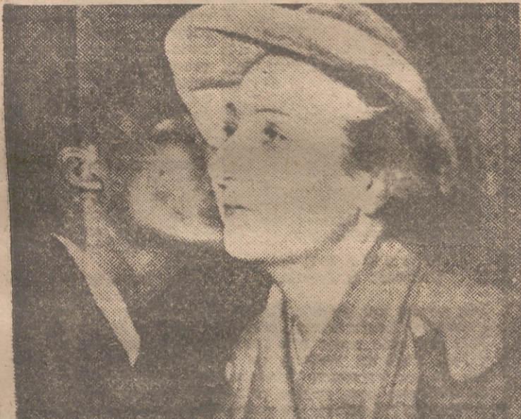
Una foto que ha dado la vuelta al mundo. Madame Auriol agradece al campeón mundial de los medianos, Ray "Sugar" Robinson, con un beso, su gesto de entregar diez mil dólares a la lucha francesa contra el cáncer.

cincuenta por ciento de la atracción del boxeo, Joe Louis puede ser otro buen porcentaje, en virtud de su victoria de la semana pasada sobre Lee Savold. Aclaremos que éste estaba reconocido como campeón mundial por el organismo pugilístico británico. Ganó el título al batir a Woodcock. Lógicamente su sucesor es ahora Joe Louis. Pero aunque al antiguo "Bombardero" no le reconozcan como tal en Norteamérica, esto es indiferente. Lo importante para él es que ha vuelto a interesar al gran público, que considera ese triunfo como su "resurrección", y puede ponerle en lontananza otro "match" contra Ezzard Charles. Desde su vuelta, el antiguo campeón sólo había peleado contra hombres de segunda fila, como el mediocre argentino César Brion, el cubano Omelio Agramonte o el vulgar Freddie Beshore. Este choque contra Savold ha sido el más resonante, y ganado como lo ganó, parece probar que siguen en pie sus formidables condiciones.