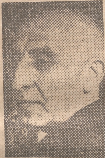
MOSSADEQ Continúa el folletín

Bien; mientras, Rusia espera su hora agazapada en la sombra, como podría decirse siguiendo el estilo folletinesco, continúa el emocionante juego entre los otros protagonistas. El primer ministro persa, Mossadeq, verdadero tipo teatral, que subraya sus discursos con melodramáticos desmayos, ha dirigido una carta a Truman, que ha sido interpretada como un ruego de mediación. El texto de la carta, no se presta demasiado a esta interpretación, más bien parece una justificación de la postura persa. Sin embargo, da pie para que Truman le dirija consejos paternales y, en vista de la difícil situación en que se han colocado los persas, no sería extraño que se alegraran de tener esta salida.