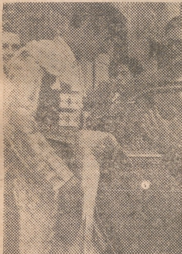
El famoso diestro mejicano Carlos Arruza, quien, luego de una prolongada ausencia en nuestros ruedos, reaparecerá en la feria de julio, toreando dos corridas

Quinto.—Manso de solemnidad. Cinco verónicas magistrales el Litri, que levantan una ovación. Tres varas y tres pares. Encerrado en tablas. Litri da ocho ayudados por alto para torrear luego al natural, dando una serie hasta de diez, que levantan al público de los asientos, por la temeridad, pues cita a dos dedos de los pitones y con la muñeca a la espalda. Cinco manoleínas enormes, sufriendo un varetazo en una de ellas, y desantes de rodillas. Tres pinchazos, estocada y descabello. (Ovación, una oreja,