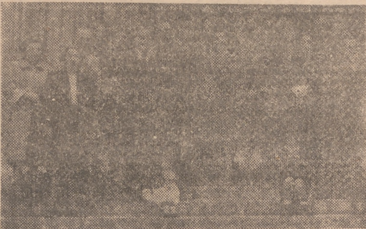
"Ha terminado la ceremonia, y el matrimonio Acero se fotografía en la puerta de la iglesia de Santa Eulalia, de Mallorca, en compañía de sus padrinos y asistentes al acto"