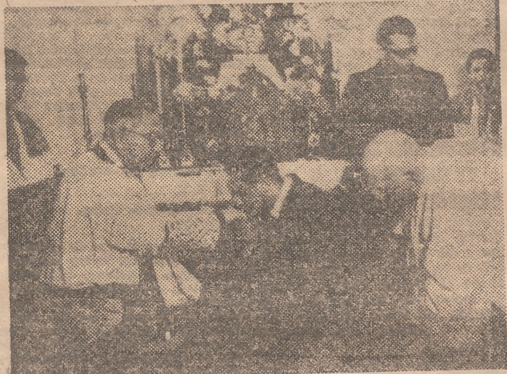
El Sr. Arzobispo bendice la clásica indumentaria estudiantil de los escolares de la Residencia Calasancio

—Con normas generales para los dos lo scolégios, cada uno tiene su reglamento de régimen interno, lo suficientemente flexible para muchachos universitarios, que asisten diariamente a las clases de las distintas facultades, para las que son preparados por nuestros profesores. Es un régimen de internado familiar, con una dirección de vida