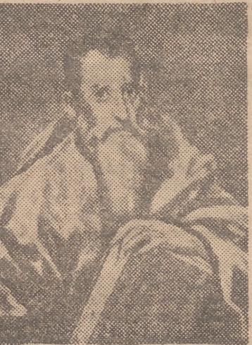
"San Pablo", del Greco

En este día de su conmemoración litúrgica, nuestra devoción al santo apóstol debe fortalecer nuestra fe en Cristo con lo que le rendiremos el mejor de todos los homenajes.