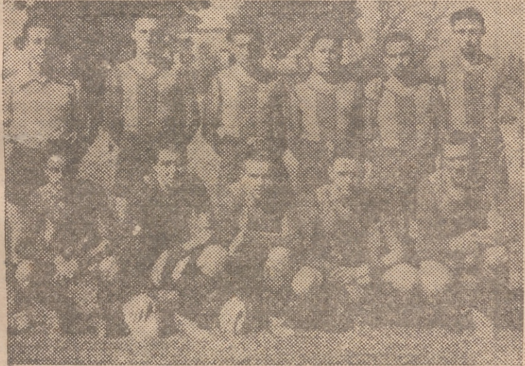
El Levante, equipo infantil, que mañana jugará contra el Sueca

Correspondiente a la Copa Federación del torneo juvenil se celebrará mañana en Vallejo el partido Sueca-Levante, decisivo para la clasificación final. Ya dijimos que de él saldrá el campeón y quizás el subcampeón, si el Levante venciera. Sobre la calidad de juego de estos equipos, esperanza de un futuro no muy lejano, nos remitimos al último partido Sueca-Valencia (juvenil) jugado en Mestalla, que arrancó de los espectadores las más cálidas ovaciones.