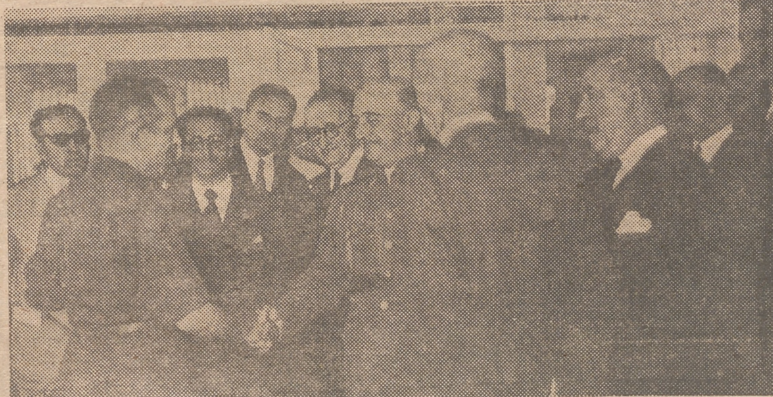
ARANJUEZ.—S. E. el Jefe del Estado, Generalísimo Franco, acompañado de ministros del Gobierno español y alto personal de Experiencias Industriales, saluda a uno de los obreros durante su visita a las instalaciones de dicha industria

“España necesita que haya fuentes de riqueza y de trabajo”, dice el Caudillo