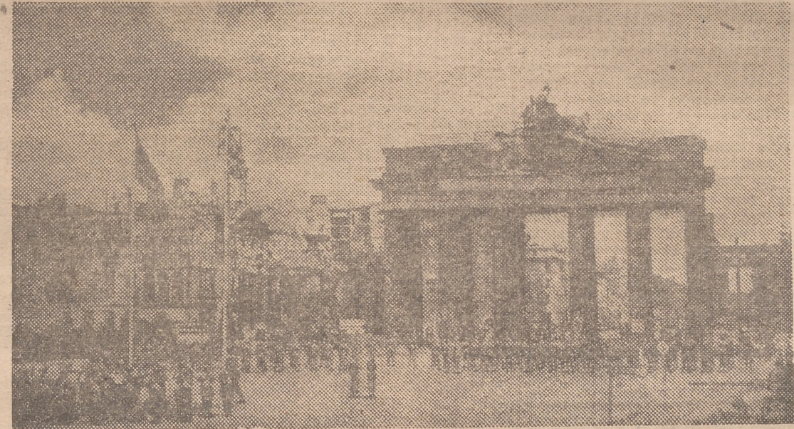
Berlin después de la guerra. En la puerta de Brandenburgo, las tropas que marcharon desde El Alamein hasta la capital alemana, desfilan ante el mariscal Montgomery