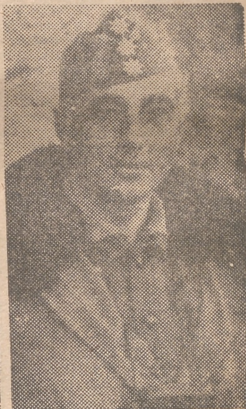
El ilustre militar general Galera Paniagua, quien ha sido nombrado recientemente gobernador militar de Valencia