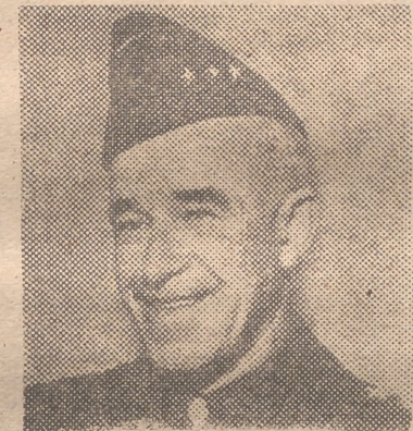
BRADLEY Un viaje eficaz

Lo cierto, es que no sólo vuelve a hablarse del rearme de Alemania, sino que este rearme toma una amplitud que hasta ahora no tenía. En los anteriores planes era cuestión de que la integración de los alemanes al ejército atlántico se hiciera a la base del "regimental combat team", es decir, una unidad superior al regimiento, pero inferior a la división. Los franceses fueron los que más insistieron en esto, ya que no querían que resurgiera un ejército alemán. Es más, al propio tiempo se llevaban a cabo conversaciones para realizar el plan Plevin, de un ejército europeo, en el que quedarán fundidos los contingentes de las diversas naciones. De este modo, no habría ejércitos nacionales, y, por tanto, no habría ejército alemán. Claro, que para llegar a esto, caso de que en verdad se llegare, hacía falta mucho tiempo, muchas negociaciones y muchas conferencias, y, mientras tanto, no habría ejército alemán, aunque tampoco lo hubiera ni atlántico, ni europeo.