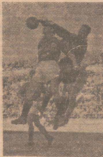
Un despeje de puño de Durán, que tuvo una buena actuación, sólo deslucida por una agresión inopinada a Vilalta

CARTER, EL NUEVO CAMPEON, VENDRA A EUROPA Nueva York, 31. — Jimmy Carter, nuevo campeón mundial de los pesos ligeros, ha manifestado que antes de poner su título en juego disputará tres peleas. Añadió que espera revalidar su título y realizar una gira por Europa, donde cree podrá ganar mucho dinero. — Añil.