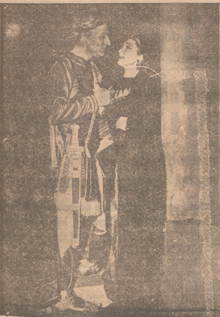
Como contribución al festival de la Gran Bretaña, sir Laurence Olivier y su mujer, lady Vivien Leigh, están representando en el teatro Saint James, de Londres, el "César y Cleopatra", de Bernard Shaw, y "Antonio y Cleopatra", de Shakespeare. Lady Olivier representa las dos Cleopatras y es la primera actriz en hacerlo en un repertorio de esta clase. Lawrence Olivier representa el papel de César en la obra de Shaw, y el de Antonio en la de Shakespeare