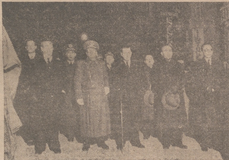
Las primeras autoridades civiles en la procesión

Acto seguido rezó unas plegarias de intención del Papa y de la hermandad entre los hombres, en todo el orbe, así como por los frutos de la acción misional.