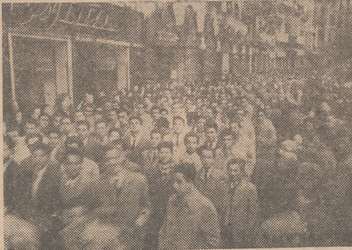
Un momento de la procesión al comenzar el año Santo en Valencia

La procesión fué presenciada por millares de fieles, que se arracimaban en las aceras y balcones de las calles comprendidas en el recorrido.