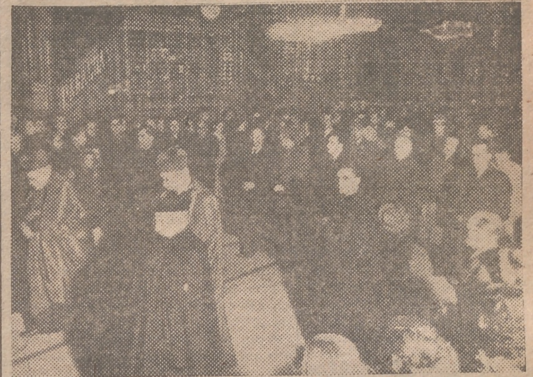
Las autoridades eclesiásticas y civiles presidieron la solemne procesión de ayer por la tarde, con la que dió comienzo en Valencia el Año Santo. (INFORMACION EN SEGUNDA PAGINA)