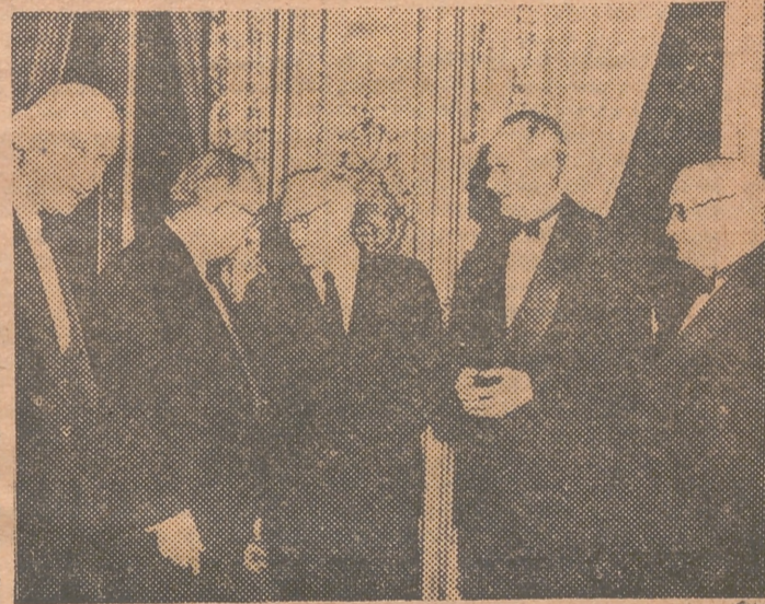
LOS CUATRO (CON AURIOL) EN SU ÚLTIMA CONFERENCIA ¿De qué hablaremos ahora?

Por lo demás, es curioso el diálogo entablado con este motivo. Rusia propone una conferencia a cuatro para tratar de Alemania sobre una base determinada. Los occidentales responden que bien, que están dispuestos a hablar todo el tiempo que quiera Molotov o Vychinsky, siempre que no se trate sólo de Alemania, sino de todas las causas de tensión internacional, y además, en lo referente a Alemania, siempre que no sea sobre lo acordado en Praga. Como se ve, en lo único que coinciden es en que haya reunión. Y al propio tiempo, norteamericanos e ingleses, sobre todo los primeros, no se recatan, en decir con nostalgia, que hay otras maneras mejores de perder el tiempo. Sólo los franceses, obsesionados por Alemania, ponen algunas esperanzas, aunque no muchas, en esa preta conferencia. Además, los occidentales, como medida de precaución, proponen incluso una reunión preliminar en Nueva York de los auxiliares o suplentes de los ministros de Asuntos Exteriores, para que lleguen a una base aceptable de discusión y un orden del día apropiados. Lo que quizás equivale a relegar la reunión principal a las calendarios griegos.