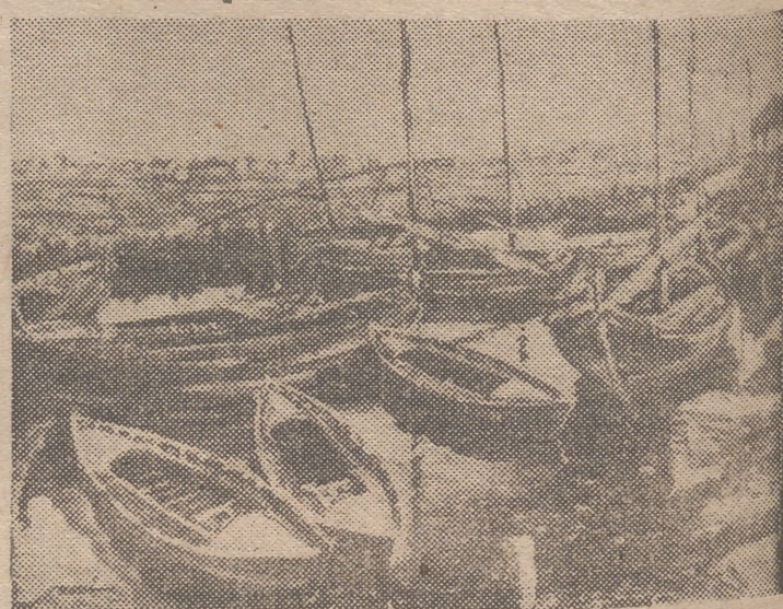
Uno de los cuadros que el notable pintor valenciano Juan Masía expone en la Sala Prat. Esta exposición, que, como todas las de Masía, está siendo muy visitada por el público, con ta de veinte obras, la mayoría de ellas dedicadas a motivos y paisajes de Albarracín