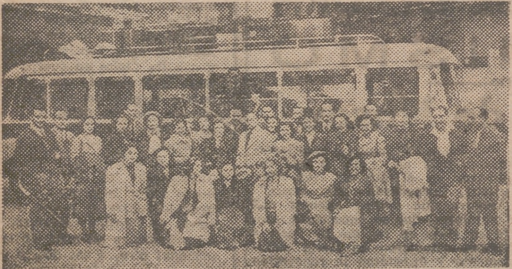
Ayer partió, con dirección a Hamburgo (Alemania), en viaje de estudios, un grupo de estudiantes de la Facultad de Filosofía y Letras de nuestra ciudad. Efectúan el viaje en uno de los magníficos autocares PHILLMAN de 30 plazas de la Empresa VIAJES Y TRANSPORTES, S. L.

La casa de muebles y decoración Mariano García, Nicolás Factor, 15, ofrece a nuestro concurso, y para obsequiar a una de las señoritas, una magnífica cama de su acreditada casa, para habitación de solteras. El precioso mueble es blanco, lacado, dorado y acolchado y podemos asegurarles que es digno de las señoritas seleccionadas por nuestro concurso y del crédito artístico de la casa que lo ofrece.