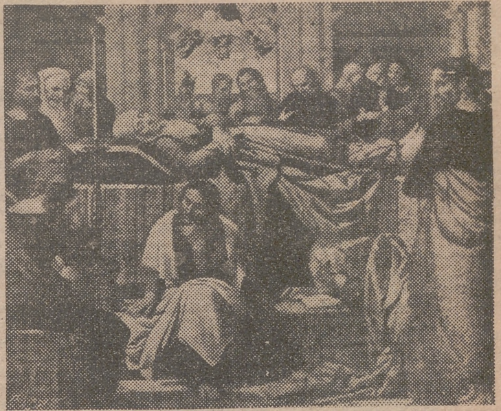
«Muerta y Asunción de la Virgen», del retablo del altar mayor de nuestra Catedral, obra de Fernando de los Llanos y Fernando Yáñez de la Almedina

Mañana, en medio de la gozosa expectación del mundo católico, el Santo Padre proclamará el dogma de la Asunción de la Virgen Santísima a los cielos en cuerpo y alma. Es ésta una creencia tan antigua casi como la misma Iglesia de Cristo, y por la que España siempre sintió una honda devoción. Los católicos han sido sometidos a un gran plebiscito, para que definieran su postura ante la definición dogmática de la Asunción. Y jamás en plebiscito alguno, ni en ninguna parte, respondió una nación de modo tan rotundamente afirmativo como lo ha hecho España. Es, pues, mañana un día de jubilosa alegría para nuestra Patria, donde, desde el Jefe del Estado al más humilde de los españoles, se esperaba con contenida emoción el momento en que el Vicario de Cristo declarara dogma una creencia que prácticamente era ya tenida como tal desde hace siglos.