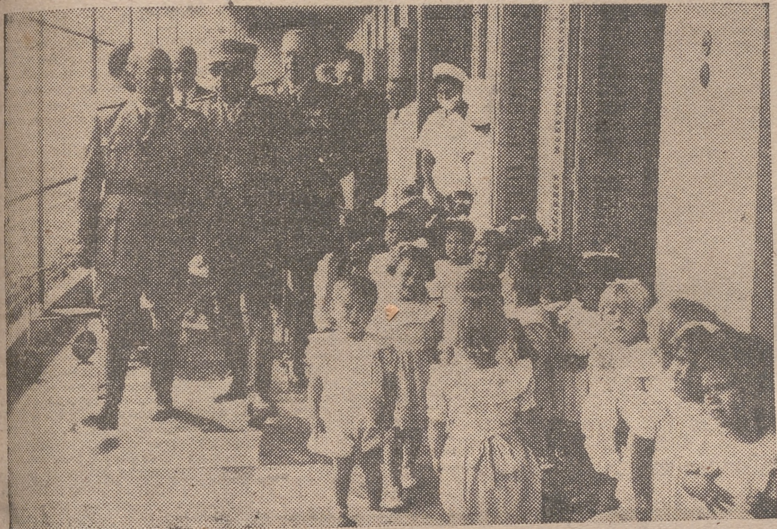
S. E. el Jefe del Estado, acompañado de diversas personalidades, durante su visita a la Casa Cuna de las Palmas.

Después de inspeccionar la zona franca internacional, se dirigió a San Fernando