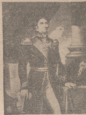
BERNADOTTE Una buena descendencia

La actual dinastía sueca tiene su origen en el mariscal francés Juan Bautista Bernadotte, y de su esposa Desirée Clary, cuñada de José Bonaparte, y primera novia que fué de Napoleón. Bernadotte, fué uno de los mejores generales de la revolución francesa y de la era napoleónica, aunque tanto, por rivalidad profesional, como por divergencias ideológicas y el celoso influjo de su mujer, se mostró apartado y frecuentemente en oposición con Napoleón. En la época de mayor esplendor de éste, Carlos XIII de Suecia, que carecía de herederos, previo permiso de Napoleón, designó a Bernadotte como príncipe heredero, prohibiéndolo con el nombre de Carlos Juan. Bernadotte no aceptó la condición que quería poner el emperador de comprometerse a no pelear nunca con Francia. Y, en efecto, las dotes militares de Bernadotte contribuyeron, en gran modo, al hundimiento de Napoleón, decidiendo la batalla de Leipzig o de las Naciones. Hubo un momento, cuando no se había decidido la restauración de los Borbones, y el trono de Francia estaba vacante, en que Bernadotte abrigó la esperanza de ser el sucesor de Napoleón, pero fracasada su candidatura, volvió a Suecia, donde en 1818 ascendió al trono como Carlos XIV.