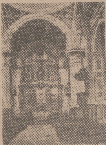
Altar mayor de la iglesia arcepresbital de Liria