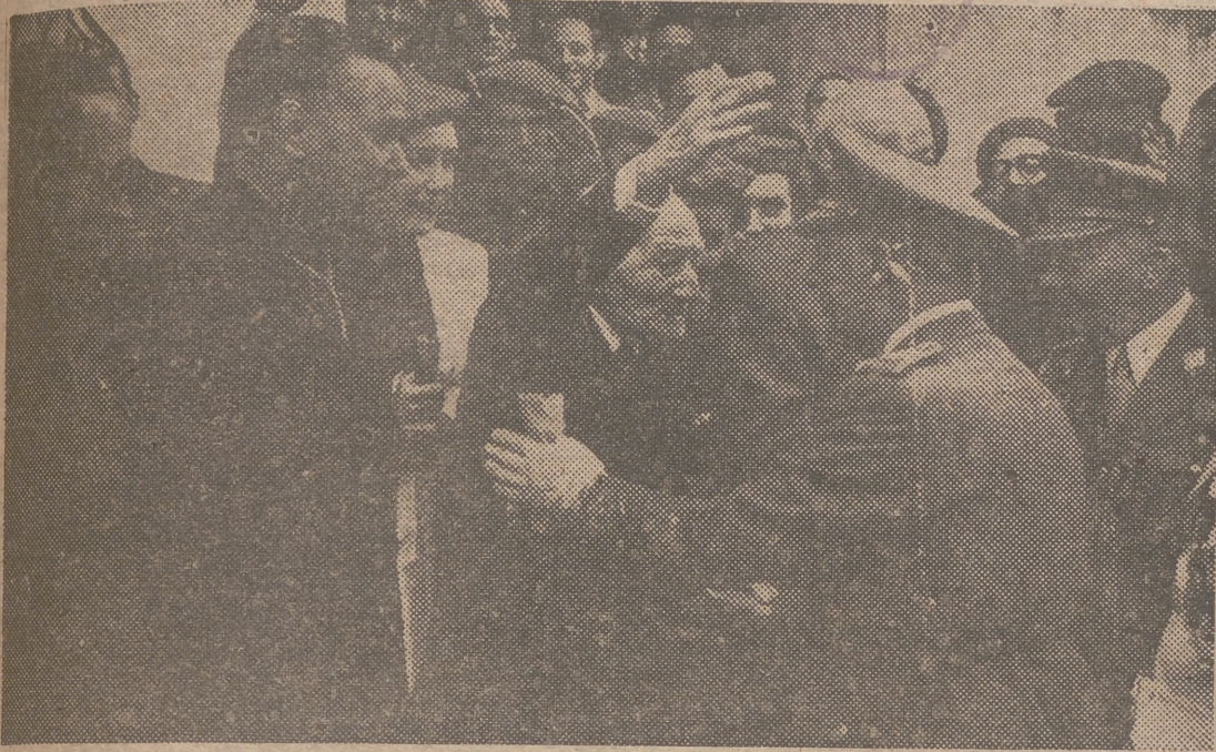
BARACALDO.—S. E. el Jefe del Estado, Generalísimo Franco, recibe un abrazo emocionante de un veterano carlista, hoy teniente honorario de los ejércitos españoles, por ley de Franco

"No valoramos al trabajador con un concepto miserable de céntimos", ha dicho el Caudillo