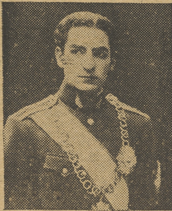
Mahomed Riza, Sha de Persia

Teherán, 5. — Cuando el Sha Mohamed Pashlevi descendió del automóvil frente a la escalinata de la Universidad, un reportero gráfico, simulando tomarle unas fotos, le disparó cinco tiros a quemarropa.