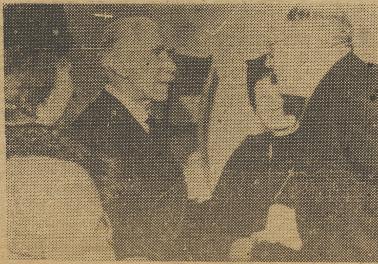
El que fué embajador alemán, Franz Von Papen, es felicitado por un amigo al final de la sesión del tribunal de desnazificación que le ha sobrepasado. El diplomático ha sido condenado