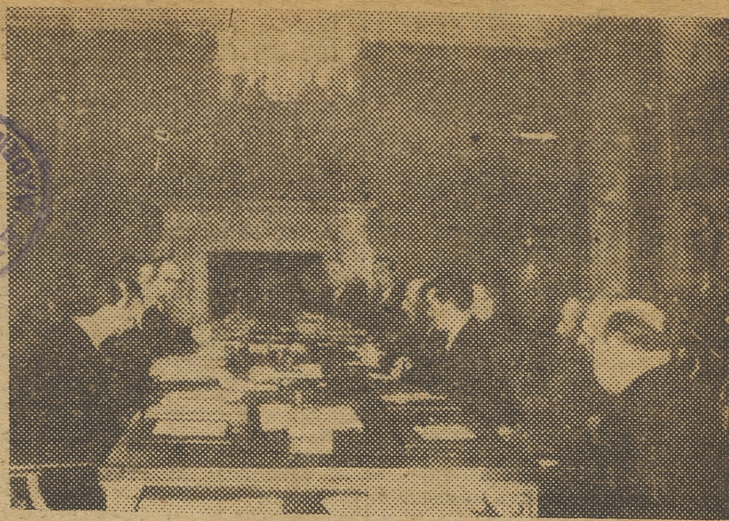
MADRID.—En el Ministerio de Asuntos Exteriores se reunieron, en virtud del Tratado de Límites Hispano-francés de 1856, las comisiones francesa y española para tratar de los límites fronterizos, vías de comunicación, pesca en el Bidasoa y utilización común de diversos pastos.