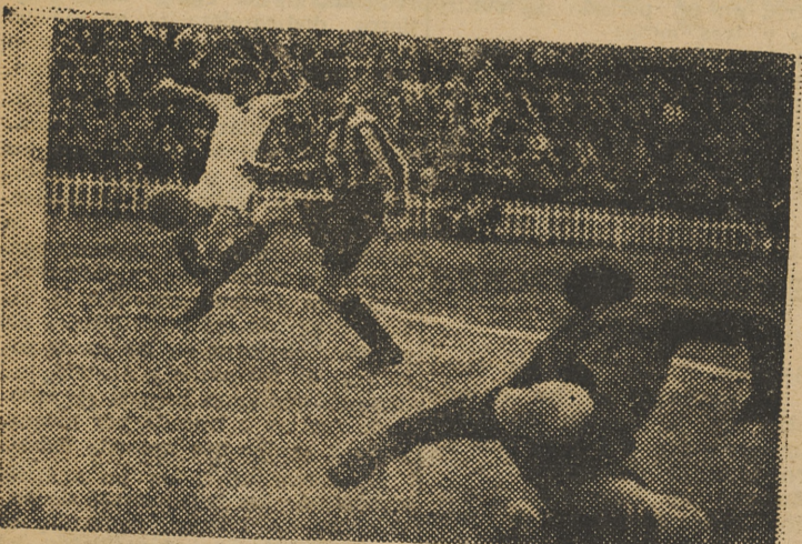
En esta ocasión, Segarra perdió una oportunidad, con el meta baracaldés batido, en el ángulo contrario