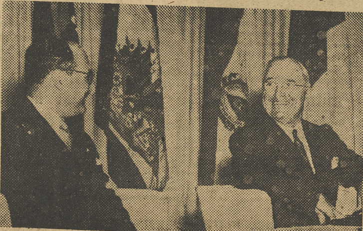
He aquí al presidente Truman, durante la sesión de clausura de la conferencia interamericana de Petrópolis. (Brasil), momentos antes de su discurso.