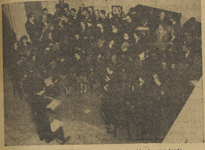
La Coral Polifónica Valentina en su actuación de ayer tarde

de Strauss, y graciosamente pintoresca la «Rapsodia española» de Ravel, dedicada a su querido maestro Berlioz. El tema español, que doce años antes intentase el piano de Ravel, con la «Habanera» incluida en ésta, en realidad, pequeña suite de introducción y final, y en medio malagueña, aquel aire trasplantado después a Cuba y una jota, lo