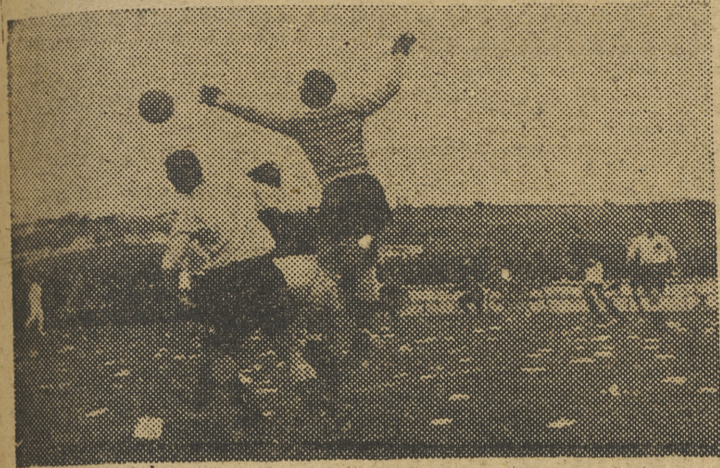
Un buen despeje de puños de Lezama, en el segundo tiempo, acosado por el delantero centro luso, Peyroteo, mientras Curta trata de protegerle. En el suelo, la «siembra» de octavillas arrojadas por ayones militares portugueses, antes de iniciarse el encuentro