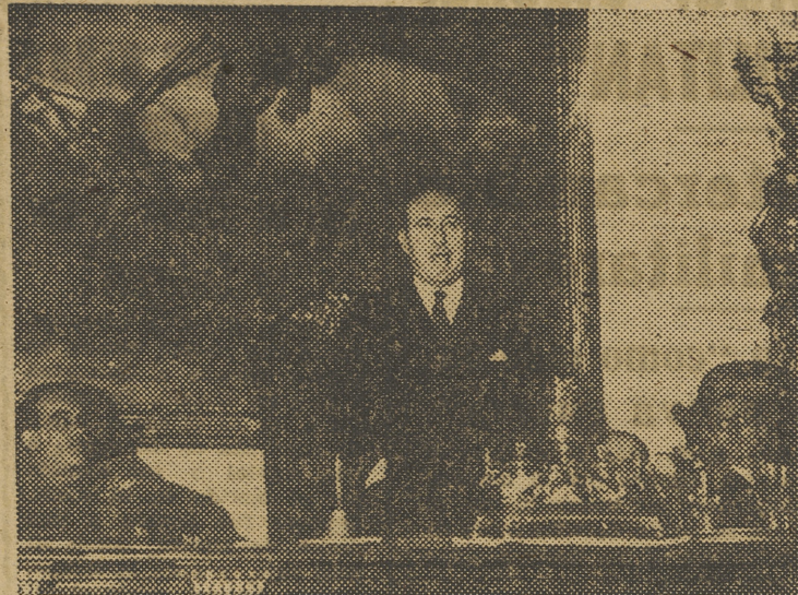
El director general de Comercio durante su discurso.

del alcalde, habló del considerable volumen de la exportación valenciana y de la necesidad de fertilizantes en la cuantía adecuada, asegurando que, merced a la labor que está ya en vías de realización, se podrá, en plazo relativamente breve, producir en España una gran cantidad de fertilizantes, que reducirá de modo considerable nuestra situación deficitaria con relación a los citados productos. Afirmó que, entre-