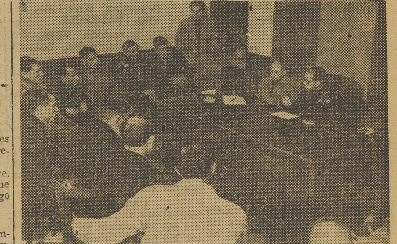
El gobernador civil preside una reunión de alcaldes y jefes locales de aquella comarca.