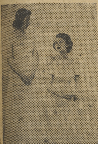
Una de las últimas fotografías de la princesa Isabel de Inglaterra y de su hermana la princesa Margarita Rosa