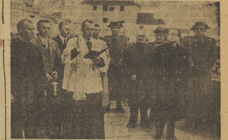
Un momento de la bendición de la nueva casa-cuartel de la Guardia Civil Arzobispo