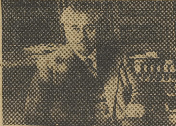
Paul Ramadier, que fué ministro de Justicia en el gobierno Blum, y que ha formado el nuevo gobierno francés