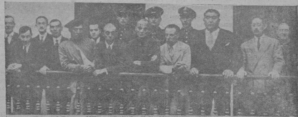
Los jurados que han intervenido en la revisión de la causa de Casas Viejas