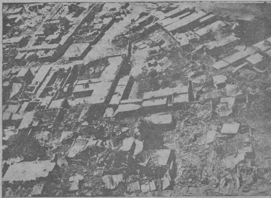
Ruinas de la ciudad de Quetta, después del terremoto que ocasionó cerca de treinta mil víctimas