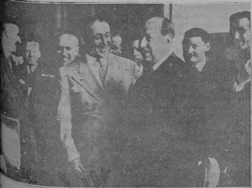
El ministro de la Guerra Sr. Gil Robles conversando con el célebre aviador Costes que llegó a Madrid con un nuevo avión francés