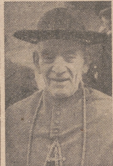
EL ARZOBISPO DE GRANADA

Del palacio de El Pardo se han interesado, por orden de Su Excelencia, por el curso de la enfermedad. También han llamado para conocer el estado del Cardenal los mi-