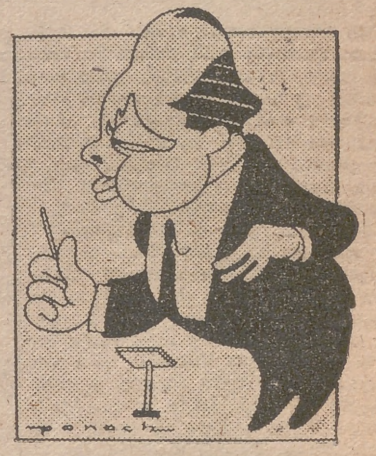
El maestro Guerrero

Manifiesta asimismo que trae un retrato del nuevo presidente argentino, general Perón, a él dedicado con todo afecto y con un emocionado saludo para España.