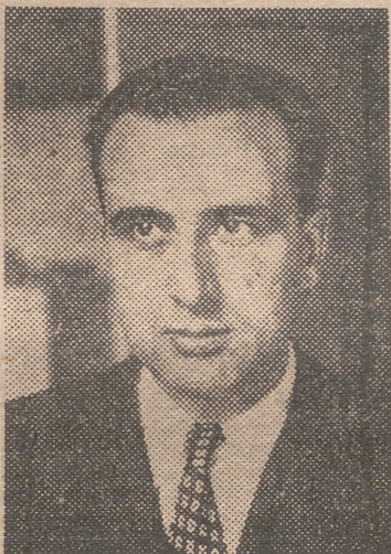
Don Joaquín Ruiz Jiménez y Cortés, que ha sido nombrado director del Instituto de Cultura Hispánica.