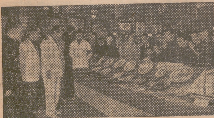
Un aspecto de la exposición de trabajos realizados por los camaradas del Frente de Juventudes, que se ha inaugurado en Meliana.

Teléfonos de JORNADA Nums. 10.617 y 15.599