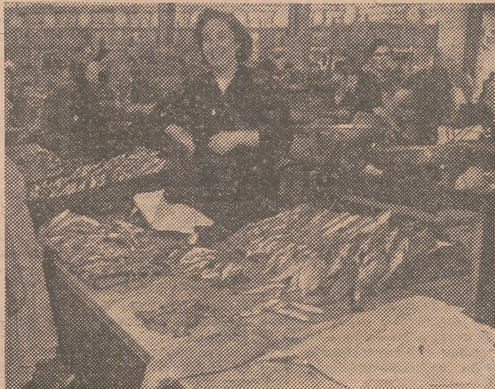
Un puesto de pescado en el Mercado Central.

Resumiendo. Que por estas y otras razones, Valencia está mal abastecida de pescado, precisamente cuando España recoge más pescado que nunca, cuando las flotas pesqueras están tomando un incremento considerable