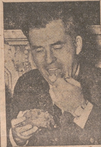
Henry Wallace, secretario de Comercio de los EE. UU.

y rusos una lección sobre la política de buen vecino proclamada por el fallecido presidente Roosevelt. En el hemisferio occidental hemos establecido un sistema efectivo de internacionalismo regional que protege plenamente la soberanía y derechos de cada nación.