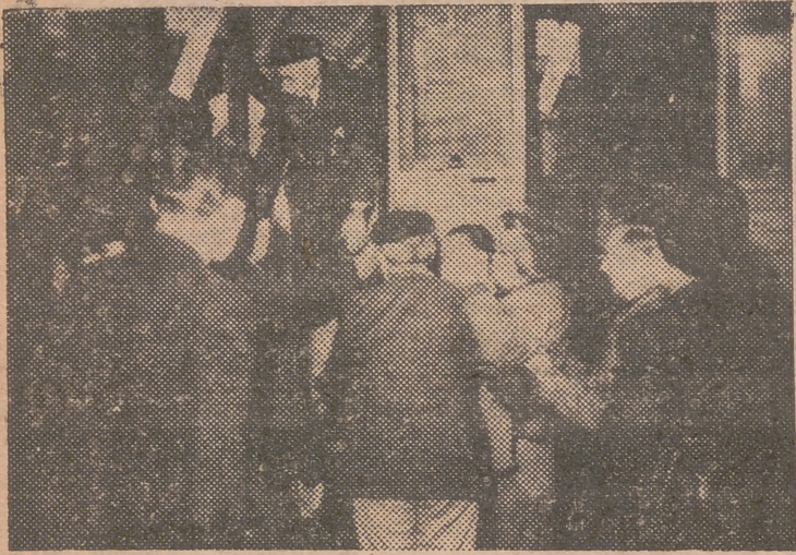
Millares de ex prisioneros de guerra de varios países y numerosos enfermos, acuden a postrarse a los pies de la Virgen, en la gruta milagrosa. En la foto, llegada de un tren de peregrinos a la estación de Austerlitz.

LA MAS GRANDE PEREGRINACION EN LOURDES, DESPUES DE LA GUERRA