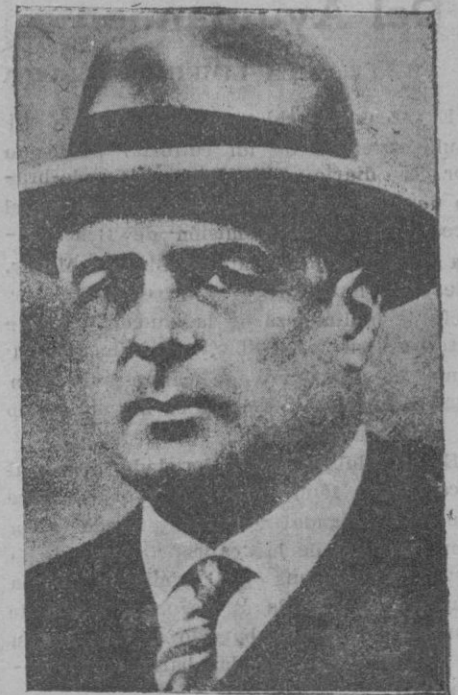
Montevideo. — El Presidente de la República Oriental del Uruguay, señor Terra, que ha sido víctima de un atentado mientras se encontraba en un restaurante en compañía del Presidente de los Estados Unidos del Brasil, señor Vargas

tre otros procedimientos, del radium, en forma de radiumpuntura y telecurietera- pia combinadas con la Rontgenterapia se según el más moderno procedimiento creado por los Pro. Melchart y Schloss de la clínica de Lainz-Viena (Prof. Schouba- er) publicado en un reciente trabajo de dicha clínica aparecido en el próximo pasado mes de enero, conteniendo una es-