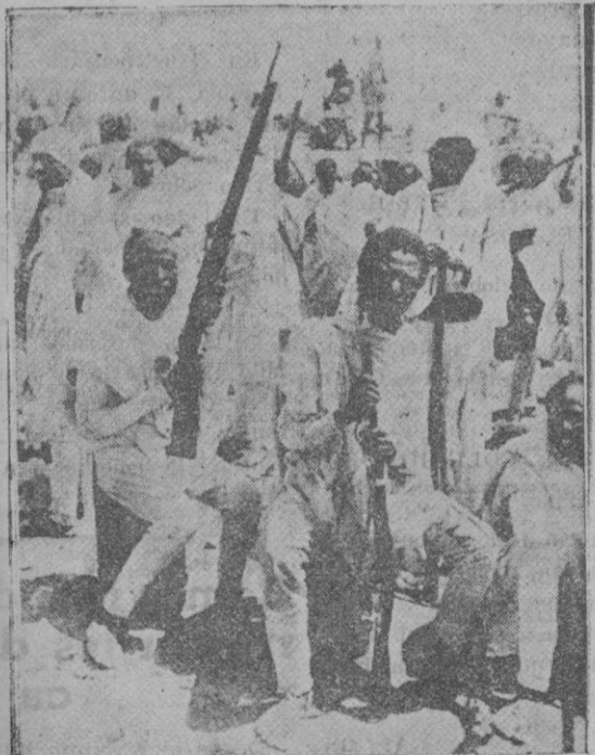
Soldados abisinios ejercitándose en el manejo de nue- vos fusiles