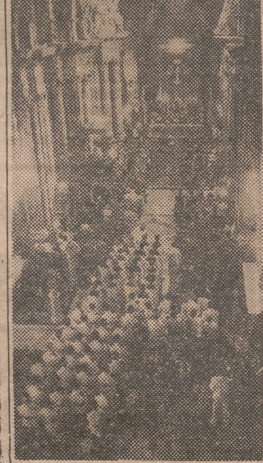
Un momento de la misa en honor de la Virgen del Carmen.

excelente Patrona de los marinos, aparecía profusamente adornado con flores e intensamente iluminado. Rendía guardia de honor, una escuadra de la referida arma.