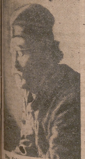
Los fotos documentales del que se aprimer resistente de Europa: Mihailovich en 1942 y en 1946

La citada empresa ha declarado que los trabajos de construcción de la refinería comenzarán inmediatamente. Dicha refinería es la tercera que la «Creole» construirá en Venezuela.—Efe.