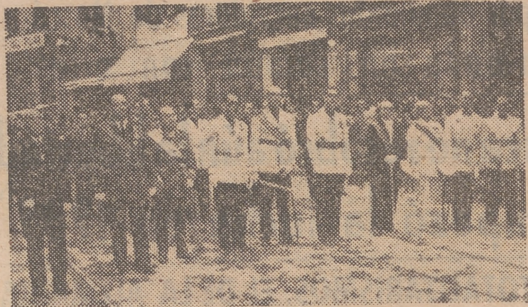
Autoridades militares y civiles que presidieron la procesión

Para la procesión, las calles del trayecto ofrecían un vistoso y mag-