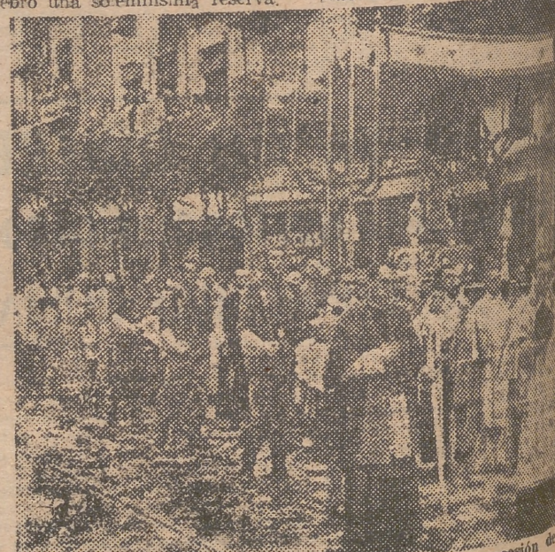
La Sagrada Custodia, bajo palio, en la procesión del Corpus, en Valencia.