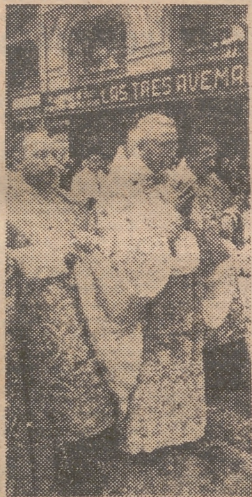
El excelentísimo y reverendísimo señor Arzobispo, en la procesión de ayer

Para la procesión, las calles del trayecto ofrecían un vistoso y mag-