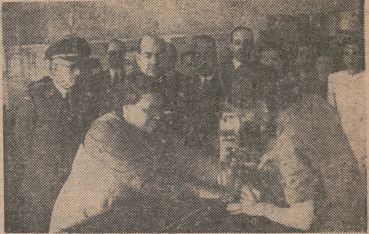
El director general de Prisiones, acompañado de otras personalidades, en el acto de la inauguración del taller de aerografía en la Prisión de mujeres de Las Ventas