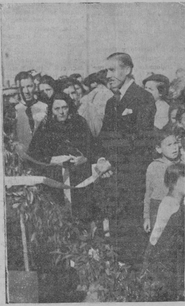
Los padrinos de la primera piedra de templo de Sta. Teresita del Niño Jesús