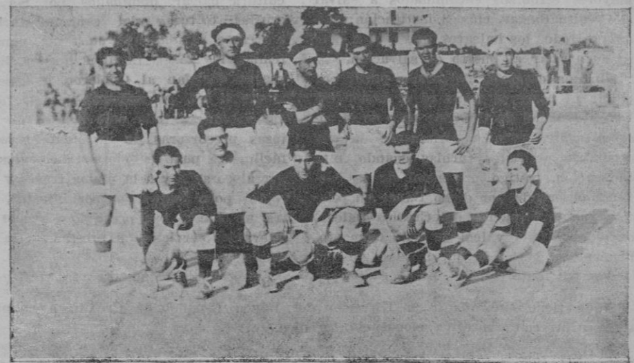
El equipo del "Deportiva Ibicenca"