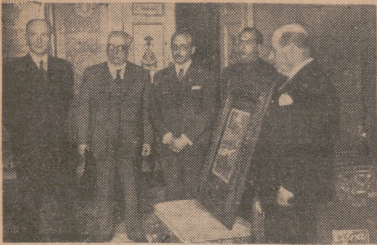
Comisión de Alcira que ha entregado al ministro del Ejército un pergamino nombrándole hijo adoptivo de la ciudad. En el antedespacho del ministro, antes de ser recibidos por éste.