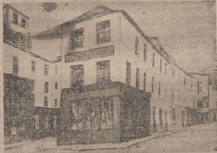
UN OLEO DE MAURICE UTRILLO