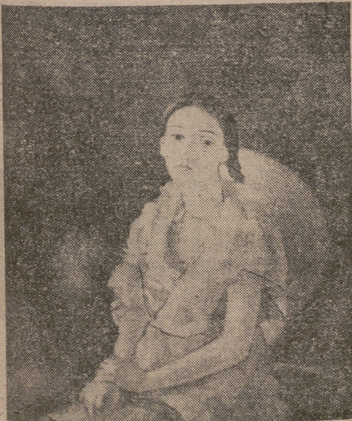
UN OLEO DE ANDRE DRAIN

Sobre la voluntad y costumbres de los más, se remontan siempre las personalidades, no importa en qué medida, y el ideal que la naturaleza les ha trazado; es inútil negarles campo, pues los menos son los que cuentan. La actitud de ellos no es más que instinto para mantener lo esencial a través de los siglos, valiéndose de lo circunstancialmente nuevo como vigorizador de algo que agoniza y es necesario infundirle nueva savia permanente, aplicando a sus lividos labios un aliento vivificante.