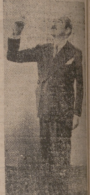
El c lebre actor brinda por la pr xima terminaci n de la guerra

La facilidad con que habla en siete idiomas, le ha convertido en un actor popular.