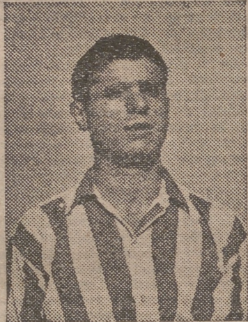
Y al llegar la conversación aquí, Urquiza, que por lo visto está escuchando, dice que ya está bien.