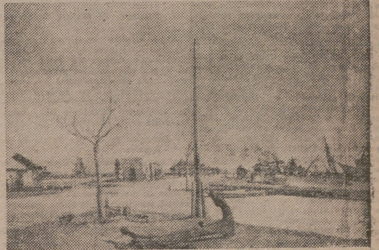
UN PAISAJE DE PORCAR

benses, más cuatro o cinco bodegones, integran esta exposición. La pintura de Alfonso Olivares se resiente de dos deméritos esenciales: la aspereza cromática y el extremoso primitivismo del que no es fácil apreciar si obedece a