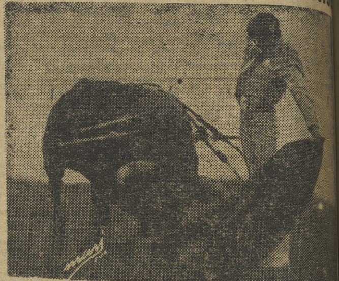
El famoso diestro cordobés, Manuel Rodríguez «Manolete» sentando cátedra de toreo en un muletazo plétorico de belleza.