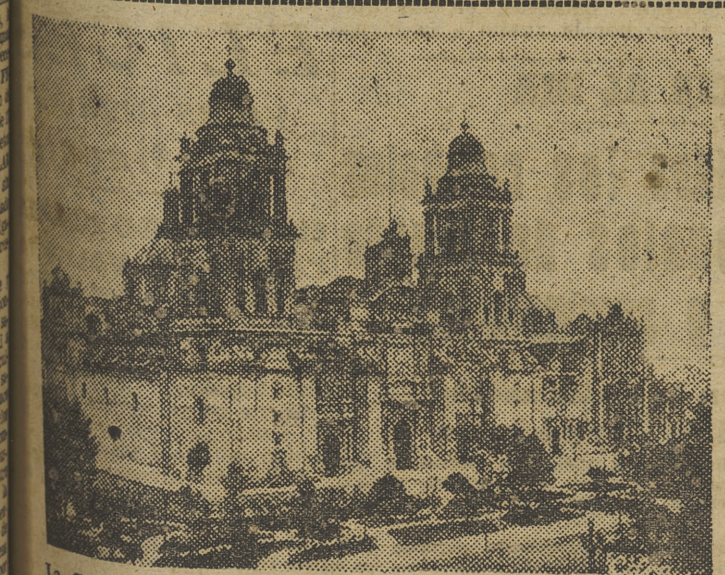
La Catedral de Méjico. En ella se encuentran los sepulcros de varios virreyes españoles y el del emperador Agustín Iturbide, héroe de la Independencia mejicana.