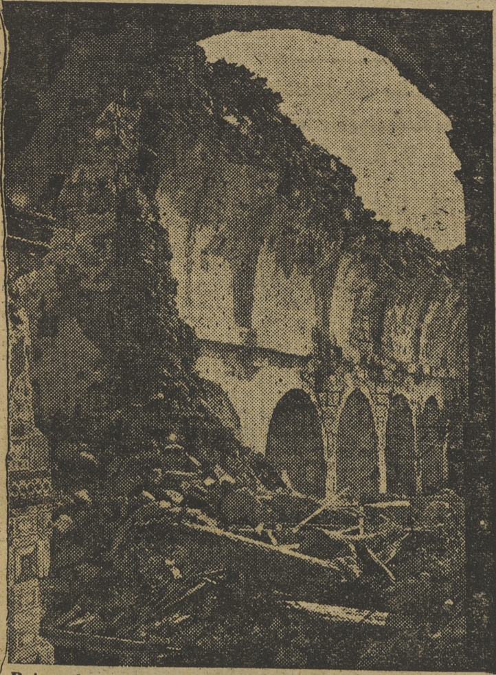
Ruinas heroicas del Santuario de Santa María de la Cabeza, símbolo del tenaz heroísmo y la ejemplar disciplina de nuestra Guardia Civil

Figuroso cumplimiento de sus deberes, constante emulación, ciega obediencia, amor al servicio, unidad de sentimiento y honor y buen nombre de la Institución; este es el supremo mandato fundacional al que sirve la Guardia Civil española desde la misma fecha de su nacimiento cuando ganó a fuerza de insuperables servicios públicos el honoroso título de Benemérita. De entonces acá desde los días del bandolerismo andaluz hasta los de las luchas sociales la Guardia Civil no cesó en la defensa de la tranquilidad y la paz en los campos y en las calles. El charol de sus antiguos tricornos fué a la luz de los acontecimientos de fines del siglo pasado y comienzos de este firme indicio de seguridad para los buenos ciudadanos; y también en nuestra guerra de Liberación tuvo su gesta culminada en la heroica defensa del santuario jienense de Nuestra Señora de la Cabeza. Motivos todos estos suficientes para que mañana en el día de su Patrona renovemos nuestra adhesión a institución tan gloriosa y ejemplar.