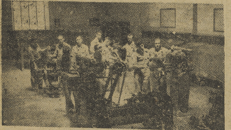
Los aprendices disponen de maquinaria moderna para su capacitación

Como hemos venido anunciando, el próximo domingo, «Manolete» actuará en la corrida organizada por la Asociación de la Prensa, alternando con «Andaluz» y nuestro paisano Jaime Marco «El Chonib», que ese día tomará la alternativa. En una entrevista que nuestro compañero «Recorte», crítico taurino del colega «Levante», ha hecho al famoso toreador de Córdoba, éste le ha manifestado que se encuentra satisfechísimo de actuar en la corrida de la Prensa y que espera dar el domingo una tarde memorable de toros. Y como es de suponer que «Andaluz» y «El Chonib» vendrán con los mismos ánimos, estamos seguros de que la fecha del 15 de octubre en Valencia pasará a la historia del toreo. Con los seis magníficos toros de los sobrinos de doña Juana Calvo, «Manolete», «Andaluz» y «El Chonib» tienen el material para realizar grandes faenas.