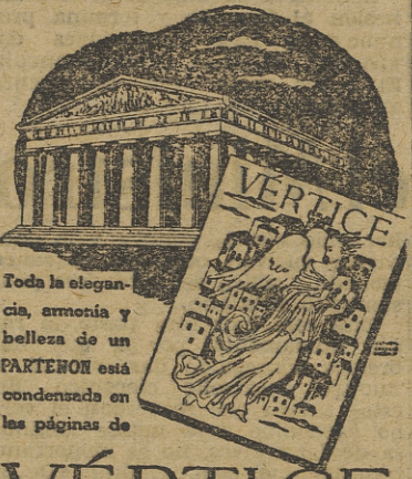
Toda la elegancia, armonía y belleza de un PARTERON está condensada en las páginas de

La escasa resistencia encontrada por las fuerzas desembarcadas por mar y aire hace pensar aquí que la primera etapa de la ocupación de las regiones helénicas meridionales llegará en muy poco tiempo a su fin y entonces el Gobierno griego exiliado podrá regresar a la metrópoli y asumir la responsabilidad de evitar la guerra civil que amenaza a este país a causa de las actividades de fuerzas disidentes cuya conducta ha sido desautorizada sin que ellos les haya movido a cambiar de postura hasta aquí.