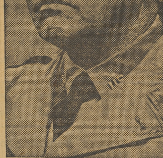
El general de División George S. Patton, del ejército de los Estados Unidos