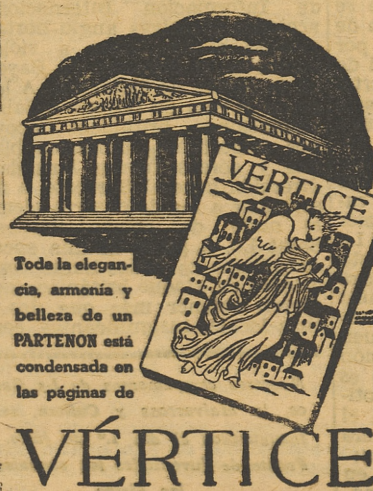
Toda la elegancia, armonía y belleza de un PARTENON está condensada en las páginas de

tánico que «el liberalismo del laissez faire se ha derrumbado»; también lo creemos nosotros y por ello no aceptamos su posible retorno después de los males ocurridos a nuestra Patria durante su vigencia. El totalitarismo ha dejado de ser una posibilidad práctica y sus principios no tienen hoy validez. España no desea recurrir a fórmulas extrañas para resolver sus problemas internos, ni aspira a constituir un Estado que copia instituciones ajenas a nuestra psicología y manera de ser; instituciones que, por otra parte, pueden ser eficaces y magníficas en los pueblos que viven a su amparo. No creemos en el fascismo, ni en el totalitarismo, ni en el comunismo. Creemos en nuestra propia y genuina voluntad de resolver los problemas españoles con arreglo a características y directrices específicas de España. Creemos en la fórmula de la unidad, como única posible para encauzar las energías españolas y dar a nuestra Patria un perfil propio y una capacidad suficiente para cumplir su misión universal. En Europa se avecinan jornadas difíciles y los pueblos deben estar preparados para resistir las embestidas ideológicas y sociales que sin duda van a producirse. Para hacerlo eficazmente sólo existe esa fórmula concreta y serena de la «libertad y el orden».