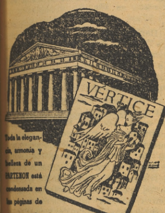
VERTICE. Toda la elegancia, armonía y belleza de un PARTENON está condensada en las páginas de VERTICE. Administración, Carretas, 10. Madrid